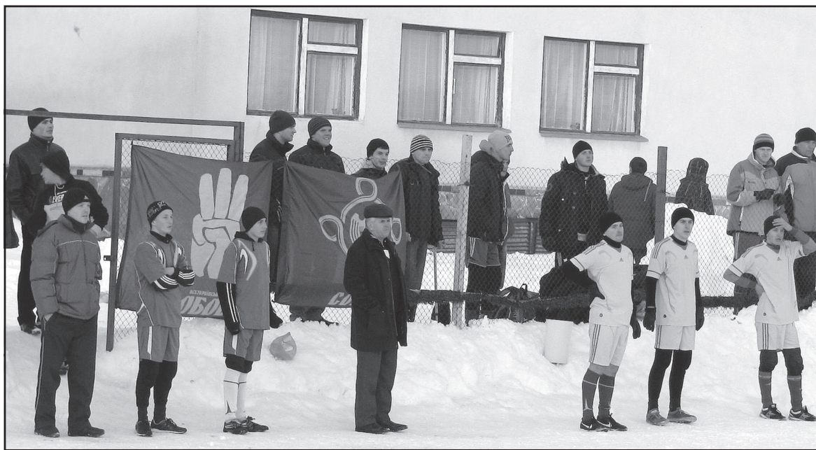
Під час турніру з міні-футболу, присвяченого пам'яті Головного Командира УПА Романа Шухевича.