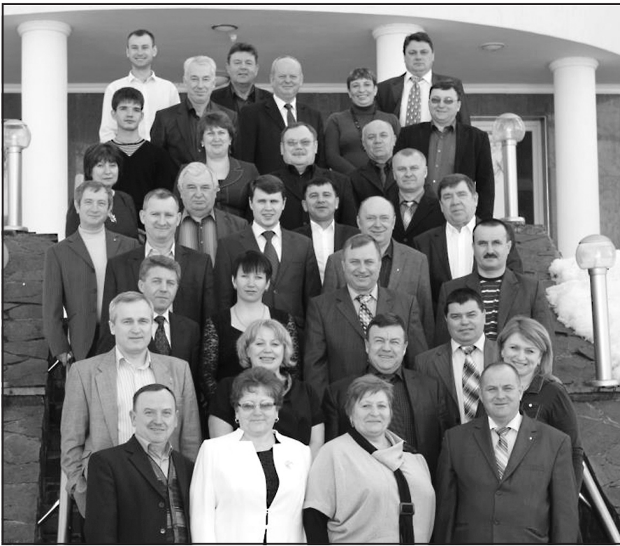
Учасники першої в Україні “Зимової школи” у с. Поляна Свлявського району Закарпатської області.