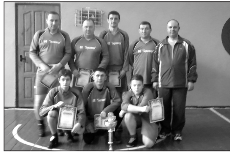
Команда ветеранів Афганістану з міні-футболу Тернопільського району.

Хоча учасники змагань давно знаються між собою й товаришують, на спортивному полі точились справжні запальні баталії. Для гравців Тернопільського району найважчим виявився футбольний двобій з представниками команди м. Тернополя. Проте фортуна того дня обрала наших — переможцями Тернопільського обласного турніру з міні-футболу серед команд ветеранів Афганістану стала команда Тернопільської районної організації Укра-