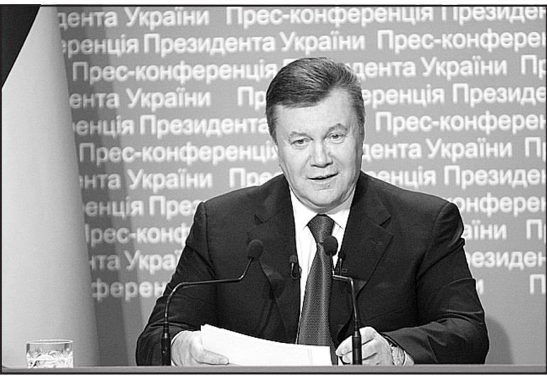
Президент України Віктор Янукович під час прес-конференції в Українському домі в Києві 1 березня 2013 р.