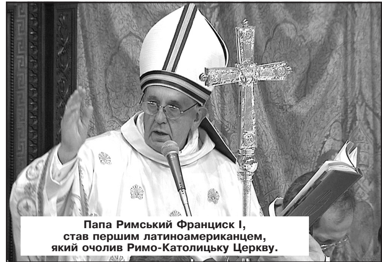
Папа Римський Франциск I, став першим латиноамериканцем, який очолив Римо-Католицьку Церкву.