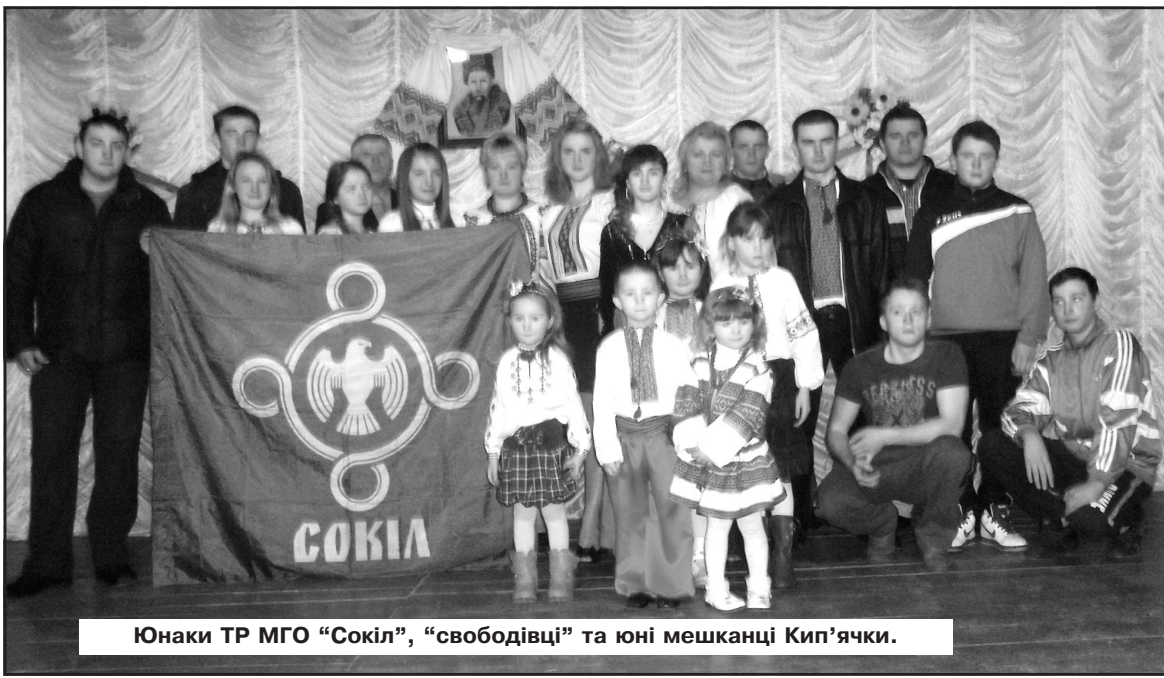
Юнаки ТР МГО "Сокіл", "свободівці" та юні мешканці Кип'ячки.