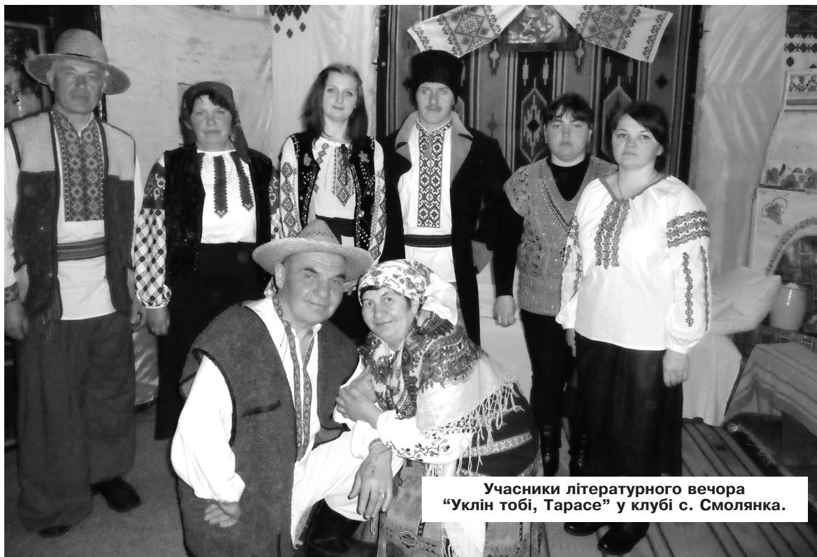
Учасники літературного вечора "Уклін тобі, Тарасе" у клубі с. Смолянка.