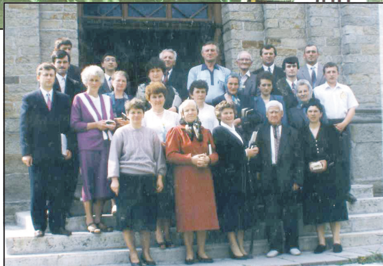
Церковний хор с. Товстолуг, 1990-ті роки.