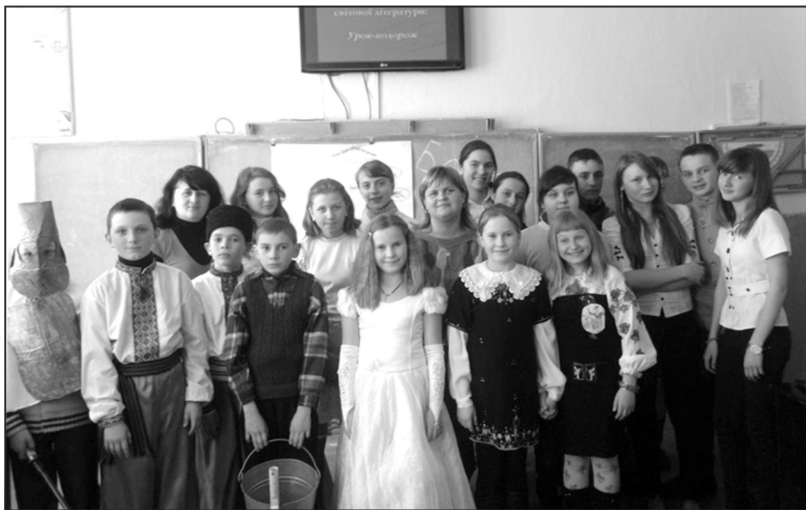
Учні Ігровицької ЗОШ І-ІІ ст. під час тижня світової літератури.