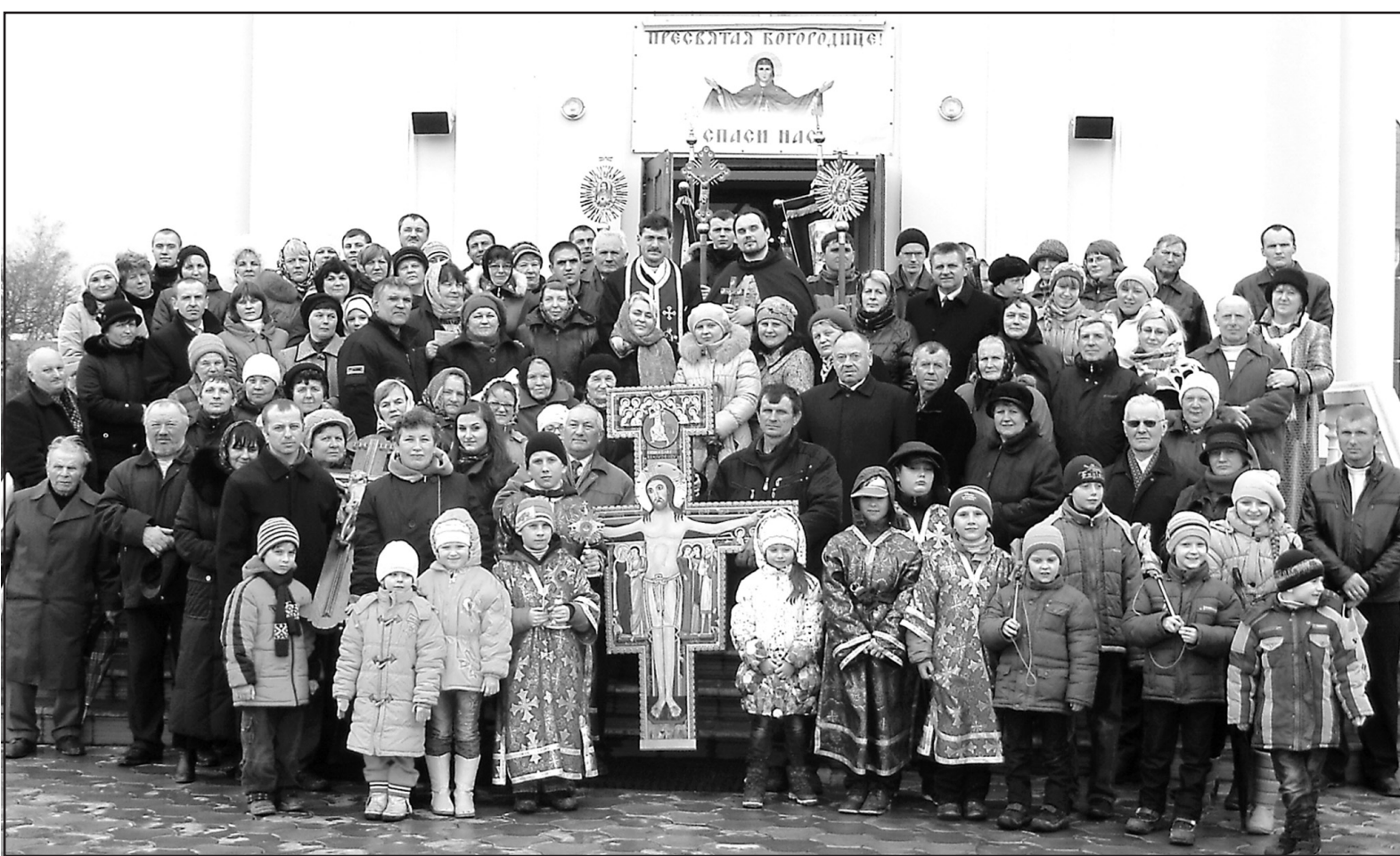
Парафія Успіння Пресвятої Богородиці Української Греко-Католицької Церкви с. Гаїв Шевченківські після закінчення Хресної дороги на порозі храму.