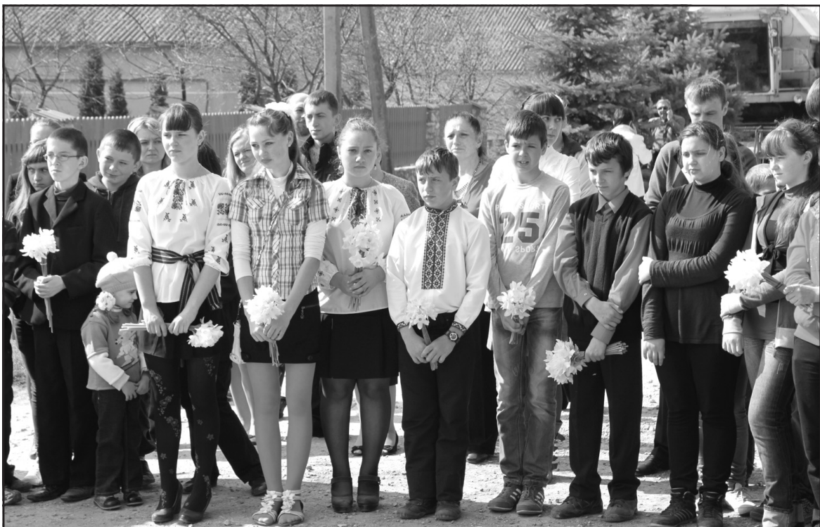
Учні Довжанківської ЗОШ І-ІІІ ст. — учасники зустрічі з переселенцями із чорнобильської “зони відчуження”.