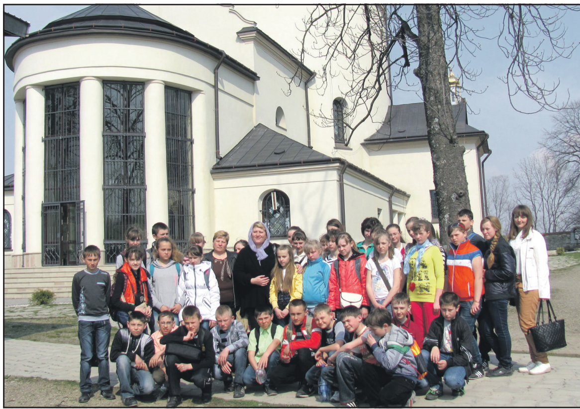
Педагоги та школярі на території Гошівського монастиря.