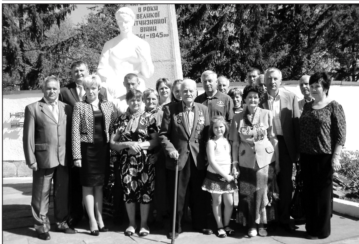
У День Перемоги на території військово-меморіального комплексу у селищі Великі Бірки.

З повагою — колектив Тернопільського районного територіального медичного об'єднання.