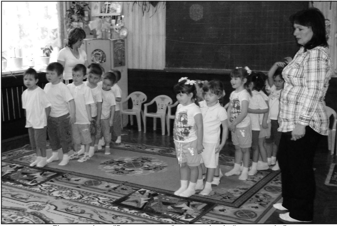
Під час семінару "Розвиток рухової активності у дітей раннього віку" в дошкільному навчальному закладі "Барвінок" у с. Товстолуг.