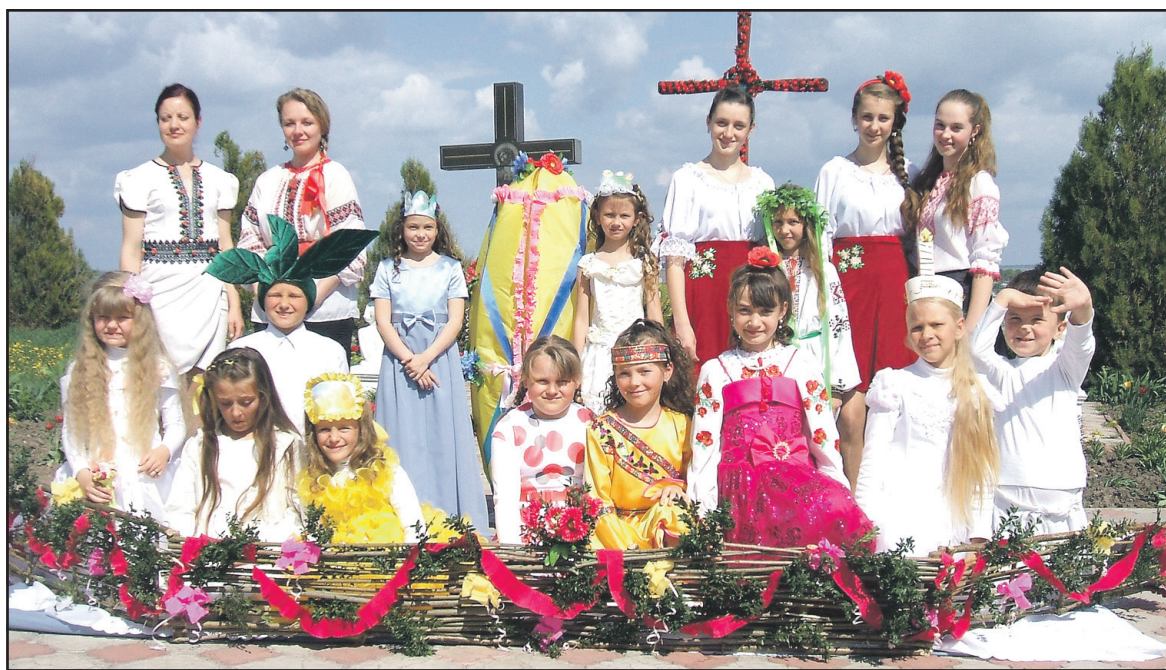
Головні герої музично-театралізованого дійства "Великодній кошик" біля церкви Пресвятої Богородиці с. Великий Глибочок.