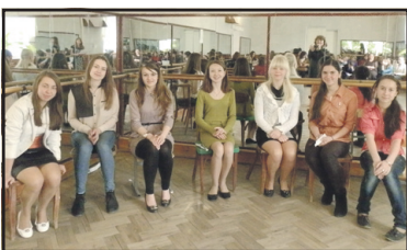
Як молоді і талановиті вчаться приймати рішення.