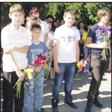
Ніхто не забутий, ніщо не забуто — фоторепортаж з Дня Перемоги у Великих Бірках і Плотичі.