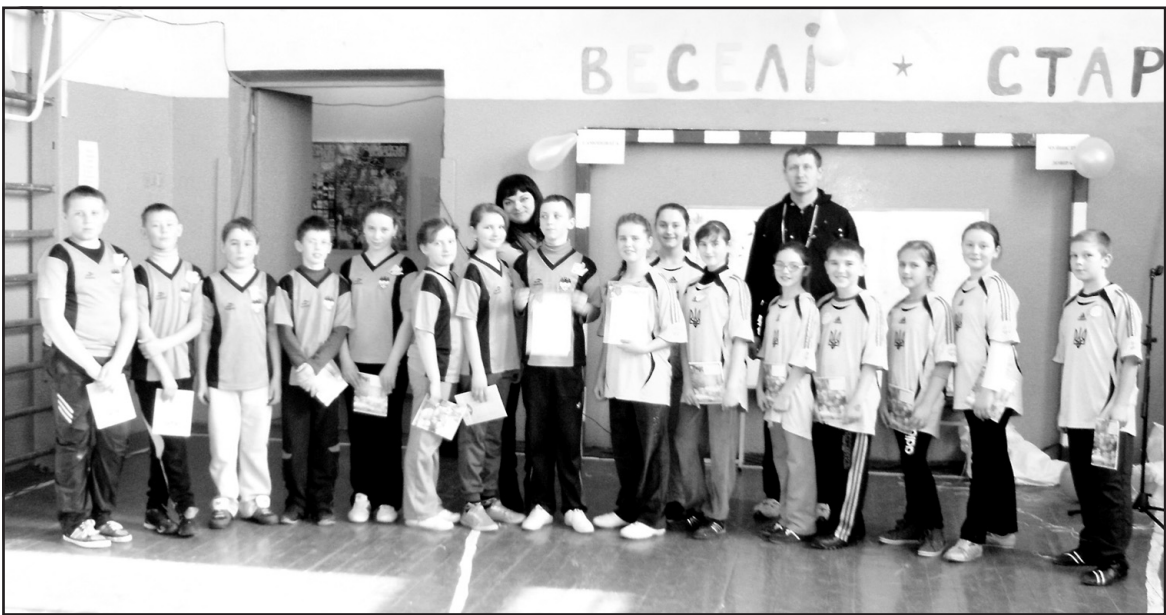
Учасники спортивних змагань "Веселі старты" в НВК "Великобірківська ЗОШ І-ІІІ ст.-гімназія ім. С. Балаєя".

Газета виходить у п'ятницю. Віддруковано видавництвом «А-Прінт» ТОВ «ДІМ», м.Тернопіль, вул.Текстильна, 28, http://a-print.com.ua/ тел. (0352) 52-27-37, (067) 350-17-94.