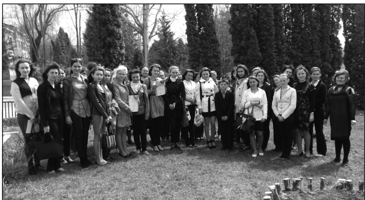
Учасники семінару "Лідер року" — старшокласники ЗОШ Тернопільського району.

Наступний конкурс стосувався фінансової діяльності. Конкурсанти запропонували наймовірне розмаїття варіантів розподілу