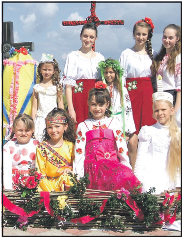
Травневі події у Великому Глибочку.

№21 (5019) П'ятниця, 17 травня 2013 року