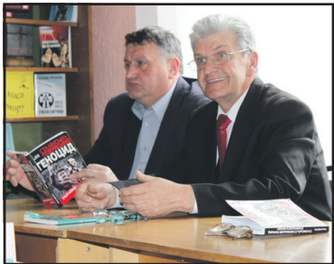
Ще раз про геноцид українців.

Електронна версія газети "Подільське слово" — на сайті http://trrada.te.ua .