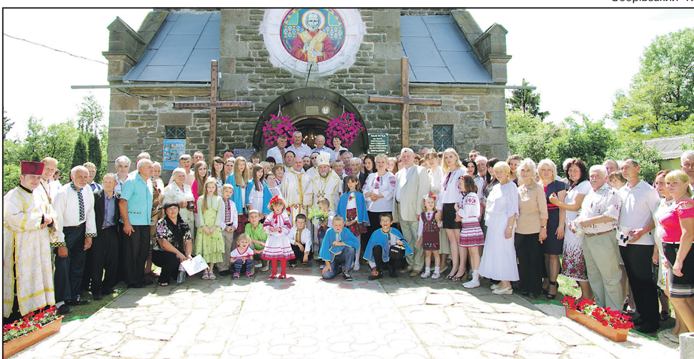
Учасники урочистостей, присвячених 100-річчю церкви Перенесення Мошей Святого Миколая Мирликійського Чудотворця.