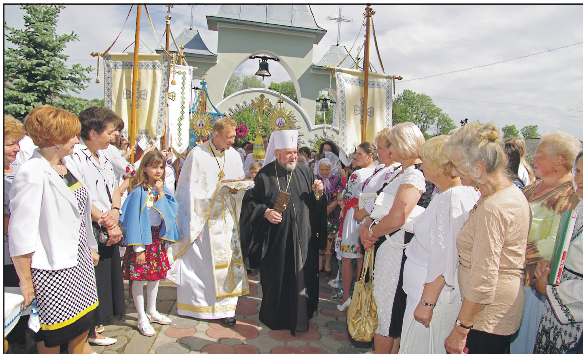
Архiepіскоп і Митрополит Тернопільсько-Зборівський Кир Василь Семенюк благословляє громаду.

Молодь Серединок привітала Архiepіскопа хлібом-сіллю на вишиваному рушникові, гарними побажаннями та запевненням, що вони збережуть рідну віру та, подібно до греко-католицьких священників початку минулого століття, будуть вірні їй та ніколи не зрадять. Василь Семенюк разом із духовенством відслужив Архiepірейську Божественну Літургію, посвятив воду біля церкви та сказав добре слово про село, його душевних та працюючих людей. Патріарх зробив короткий історичний екскурс у столітню давнину, згадав блаженної пам'яті отця Ізидора Глинського як організатора "Просвіти" та його ревних послідовників, які внесли значний вклад у культурний розвиток села. "Церква у Серединках, — мовив Архiepіскоп, — завжди була двигуном передових ідей та по-