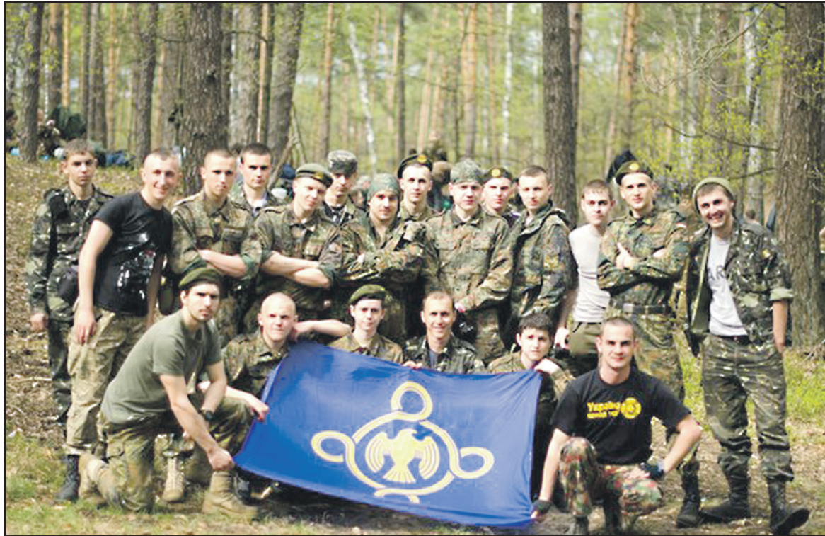
Учасники спортивної теренової гри "Гурби-Антонівці" — представники Тернопільської районної МГО "Сокіл".