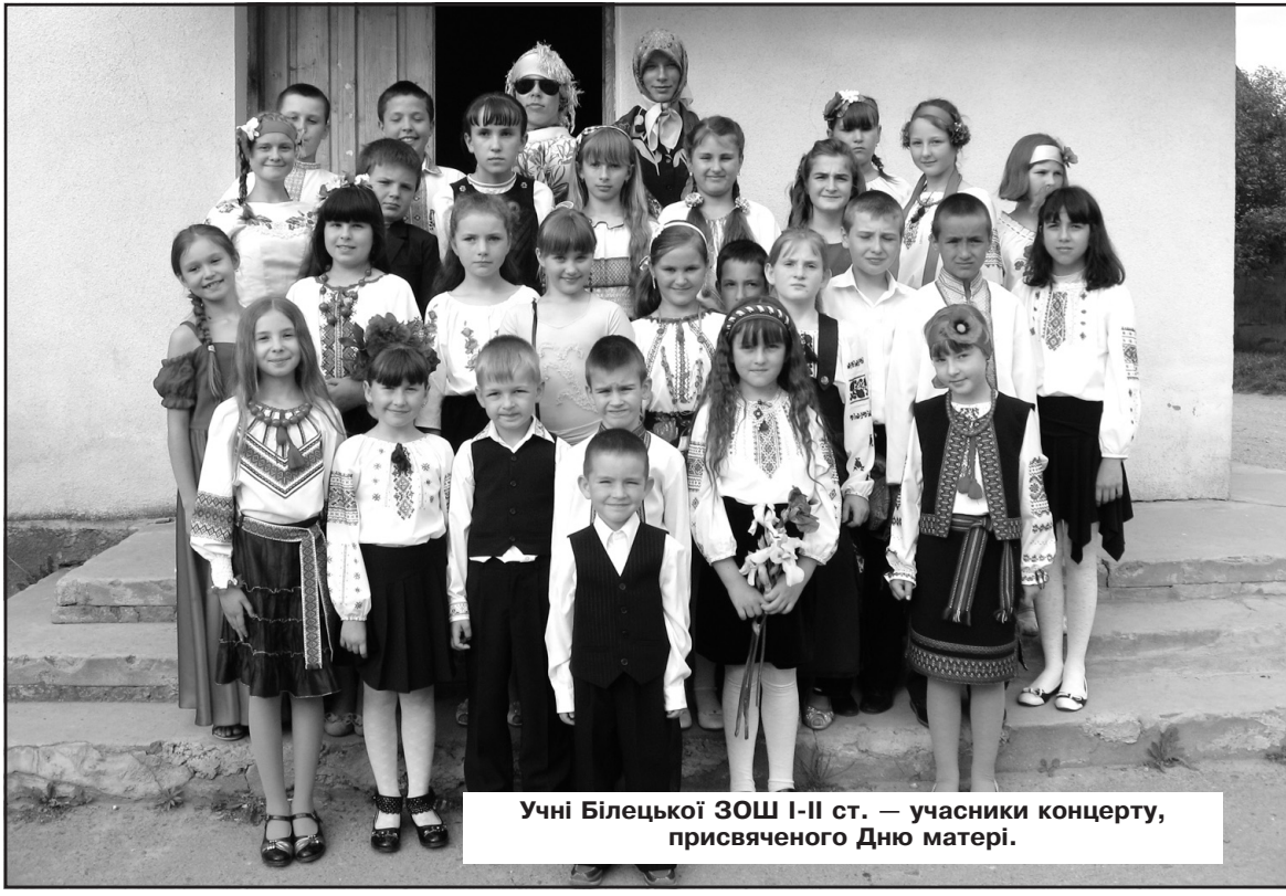
Учні Білецької ЗОШ І-ІІ ст. — учасники концерту, присвяченого Дню матері.

Відділ взаємодії із ЗМІ та громадськістю Тернопільської об'єднаної ДПІ.