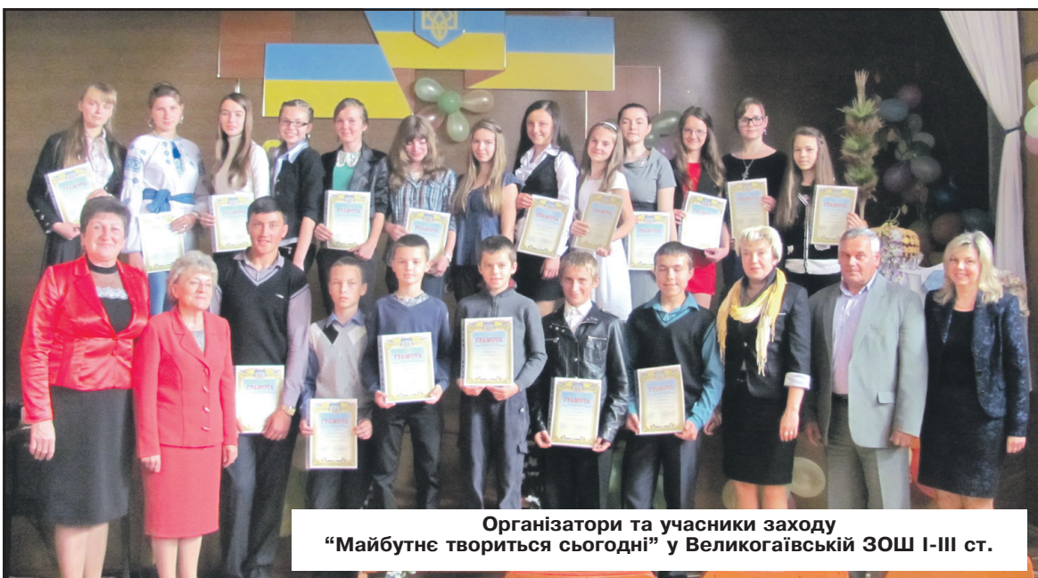
Організатори та учасники заходу "Майбутнє твориться сьогодні" у Великогаївській ЗОШ I-III ст.