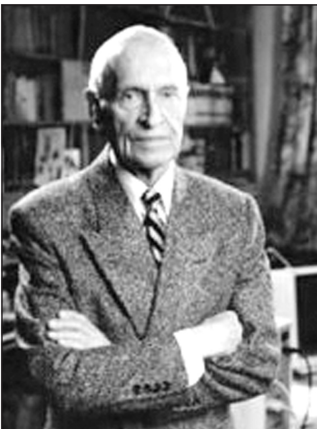
Герой Соціалістичної Праці, лауреат Ленінської і трьох Державних премій України, академік НАН і АМН України, заслужений діяч науки України, професор, доктор медичних наук Микола Амосов, 1990-ті роки.

6 грудня 2013 року виповнюється 100 років від дня народження видатного вченого і геніального хірурга, основоположника серцевої хірургії, медичної та біологічної кібернетики в Україні, письменника і громадського діяча Миколи Амосова. Ювілей відзначатиметься на державному рівні під егідою ЮНЕСКО. 2013 рік оголошено роком Миколи Амосова у галузі медицини.