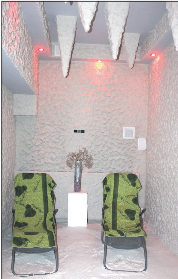
"Соляна печера" — кабінет спелеотерапії, який порівнюють з соляними шахтами Солотвино.