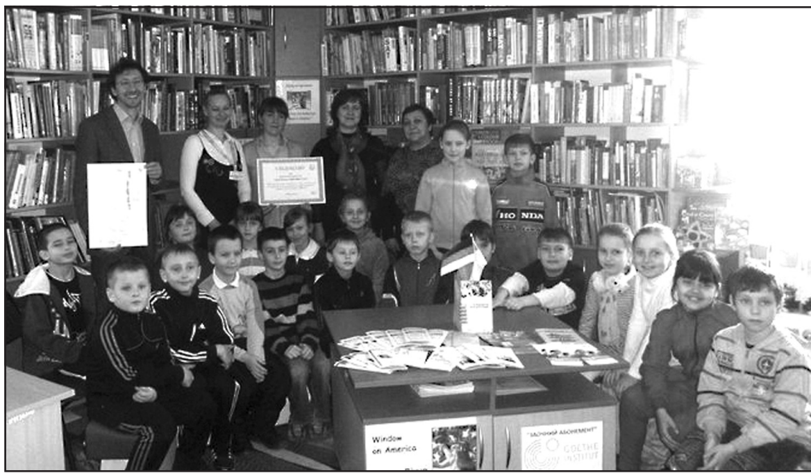
Під час презентації Німецького дитячого кутка в Тернопільській обласній бібліотеці для молоді.