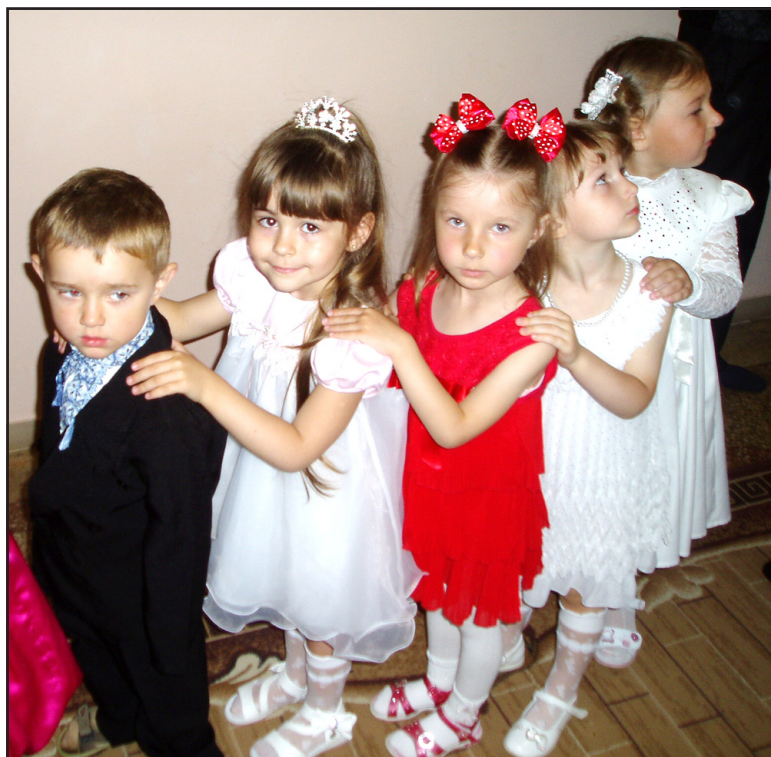
Винуватців торжества вітають наймолодші вихованці дитсадка "Сонечко".