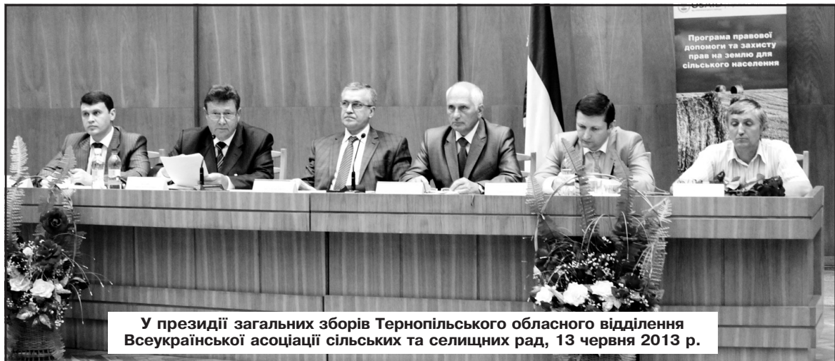
У президії загальних зборів Тернопільського обласного відділення Всеукраїнської асоціації сільських та селищних рад, 13 червня 2013 р.