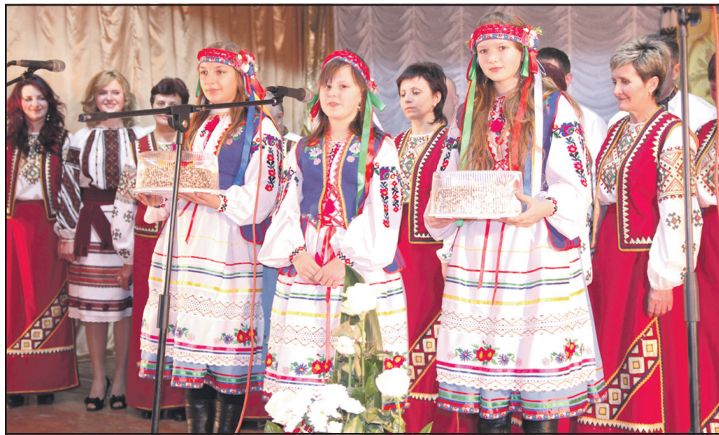
Святкове віншування від молоді села та аматорів сцени с. Кип'ячка.

подарська діяльність — без перебільшення, епоха у житті Кип'ячки. Саме у цей час у селі постали новозбудовані школа, клуб, бібліотека. Було підведено газ, прокладено асфальтову дорогу, упорядковано став.