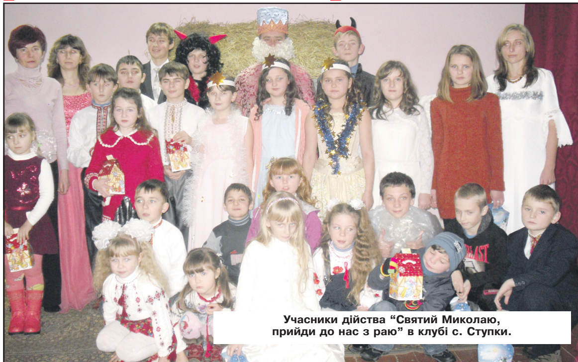
Учасники дійства "Святий Миколаю, прийди до нас з раю" в клубі с. Ступки.

Великою радісною несподіванкою для всіх ступківчан, а особливо для дітей, була гарна пухнаста ялинка, яка на день святого Миколая зазяла різнобарвними вогнями. Цю