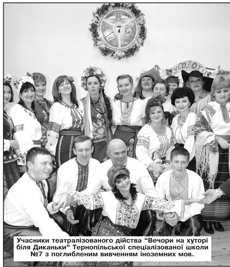
Учасники театралізованого дійства “Вечори на хуторі біля Диканьки” Тернопільської спеціалізованої школи №7 з поглибленим вивченням іноземних мов.

— На жаль, керманічам майбутнього нашої держави — українським політикам не вигідно думати про майбутнє країни. Їм важливо, аби їх електорат якомога довше залишався неосвіченим і таким недалеким, як він є. Гадаю, Україна зміниться через 20-25 років, коли підросне нове покоління українців. Головна проблема — як за цей період подолати корупцію — хворобу, яка здатна передаватися генетичним чином.