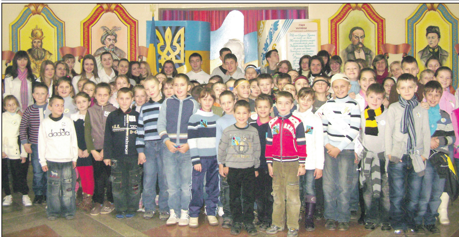
Учасники ігroteки "Діти мають права" у Великогаївській ЗОШ I-III ст.