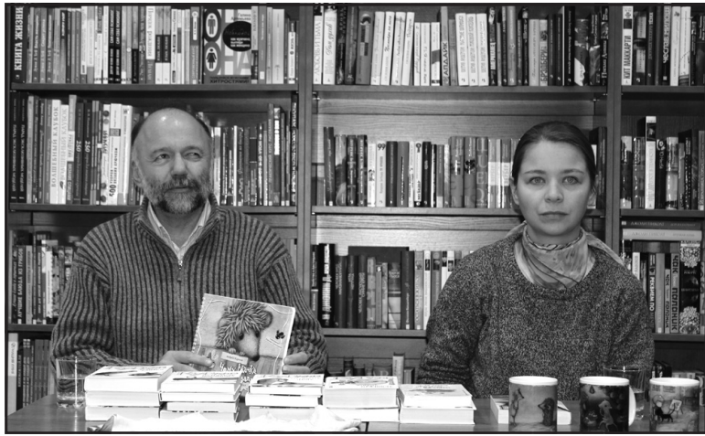
Нещодавно письменник Андрій Курков (зліва) та художниця Тетяна Горюшина у тернопільській книгарні “Є” репрезентували книгу для дітей “Чому їжачка ніхто не гладить”.

— Бажання відпочити від негативу. Дитяча література вимагає налаштувань на позитивне, дозволяє абстрагуватися від болочих проблем сьогодення. Написання казок для дітей спонукає до відповідальнішого ставлення автора, ніж коли він