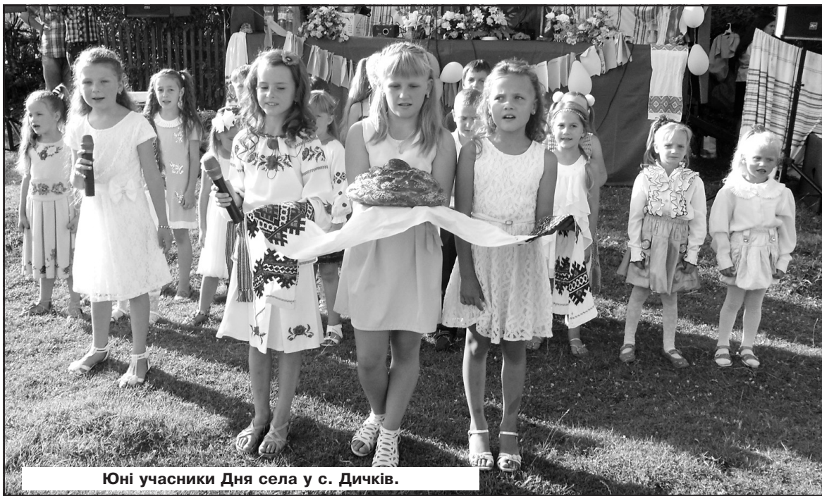
Юні учасники Дня села у с. Дичків.

— Приходь до мене в гості. В мене з'явився новий собака. — А він не кусається? — Ось я і хочу це перевірити.