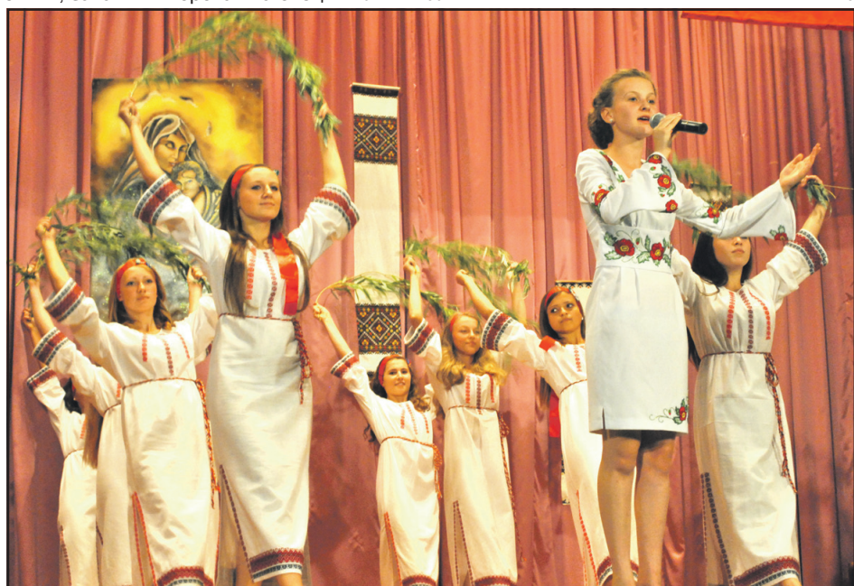
Під час концерту, який підготували учасники художньої самодіяльності Великих Бірок, у будинку культури яблуку ніде було впасти.

Таким чином великобірківчани намагалися показати, що українців з поляками пов'язує немало — це і культура, й історія, містечтво, особистості, що мали стосунок як до України, так і до Речі Посполитої. Серед уродженців Великих Бірок багато відомих у Польщі представників двох культур, української і польської. Це — академіки Польської Академії Наук, нагороджені найвищою польською відзнакою — орденом Відродження Польщі: Степан-Максим Балеї — психолог, педагог, філософ, доктор філософії (1911), член НТШ (1917), доктор медицини (1923), професор Варшавського університету (1927); Кароль Дейна — мовознавець-славіст, доктор філологічних наук з 1959 р., професор Лодзького університету (1954 р.). Є почесні військові — генерал Степан Жидек та відомий польський військовий історик, полковник Антоній Карпінський.