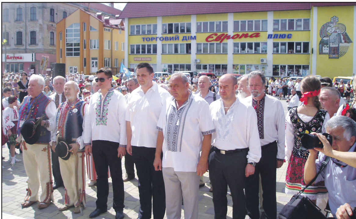
Організатори та почесні гості XV Всеукраїнського фестивалю "Дзвони Лемківщини" на центральній площі міста Монастириська Тернопільської області.