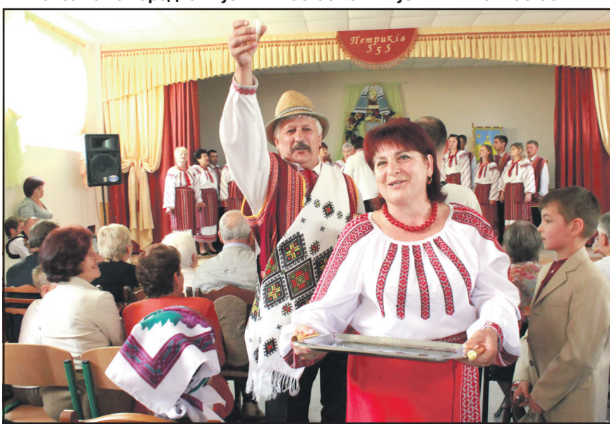
Дзвінкою пісню і солодкою наливкою у Петрикові частували учасники народного аматорського хору клубу с. Великі Гаї.