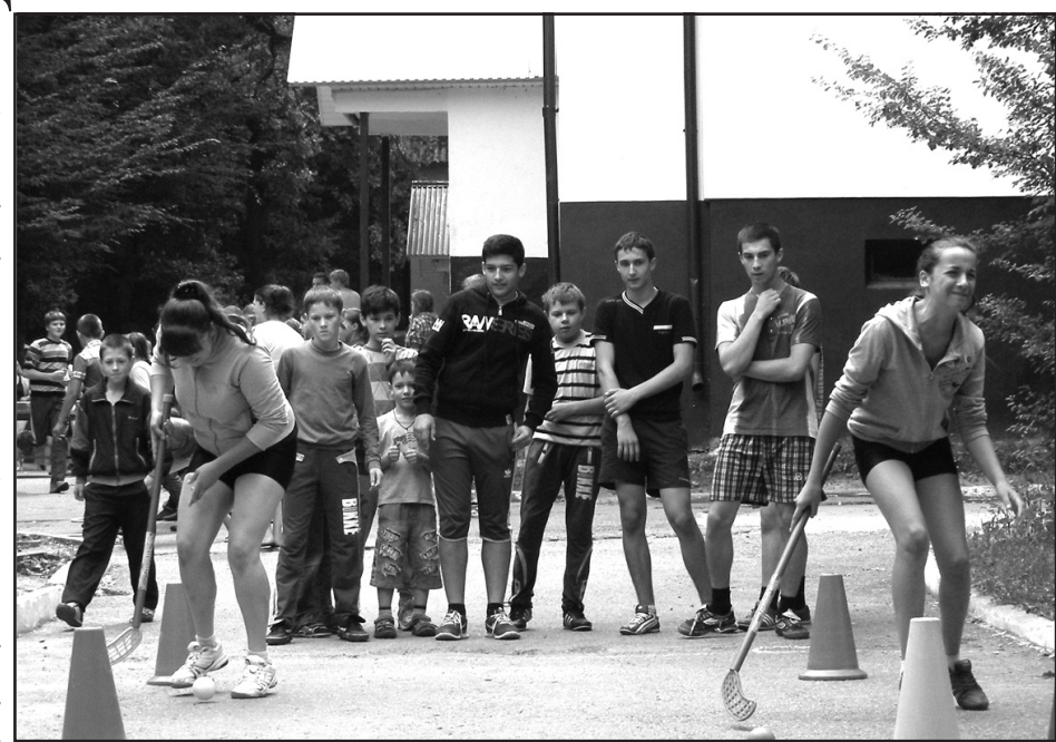
“Олімпійське літо” в оздоровчих таборах Тернопільщини.

казка” Лановецького району, “Гайдарівець” Шумського району, “Лісовий” та “Лісовий дзвіночок” Бучацького району, “Веселка” Тернопільського району, у Старому Збаражі Збараського району взяли участь більше двох тисяч учасників. Зокрема, у Старому Збаражі відбулись змагання з міні-футболу, пляжного волейболу, гірського спорту та різноманітні спортивні розваги, організовані Старозбаразьким сільським центром фізичного здоров'я населення “Спорт для всіх”. У змаганнях з міні-футболу перемогу здобула команда Старий Збараж-2, на другому місці — команда Старий Збараж-1, на третьому — команда с. Верняки. У змаганнях з волейболу перемогла команда Верняки-2, друге місце виборола команда Старий Збараж-1, на третьому місці команда Старий Збараж-2. Діти, учасники спортивно-масових заходів, отримали призи з логотипом обласного центру “Спорт для всіх”, Терно-