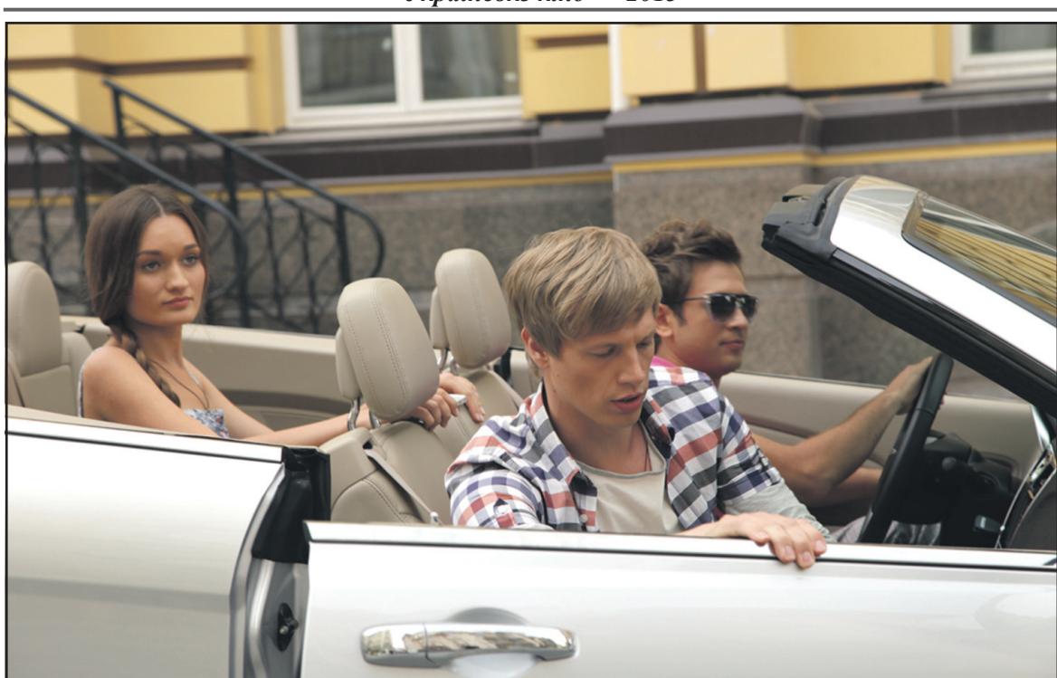
Кадр з фільму "Київський торт".