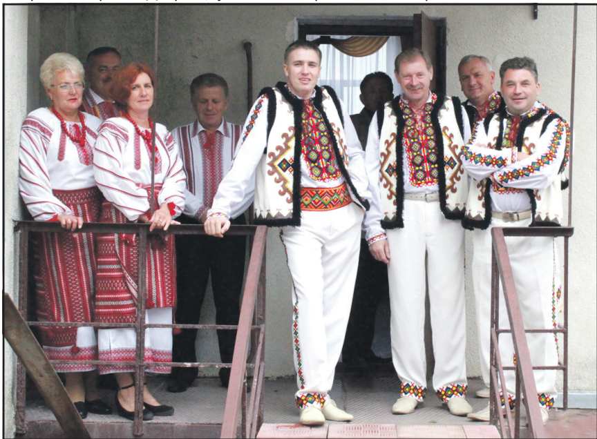
На свято до петриківчан завітали учасники народного аматорського хору клубу с. Великі Гаї та народного аматорського ансамблю народної музики «Настасівські музики» БК с. Настасів.