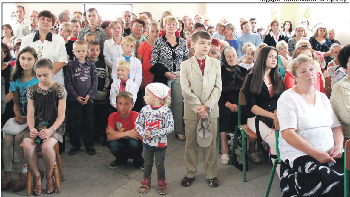
Петриківська громада та гості села під час концерту з нагоди 555-річчя першої письмової згадки про Периків.