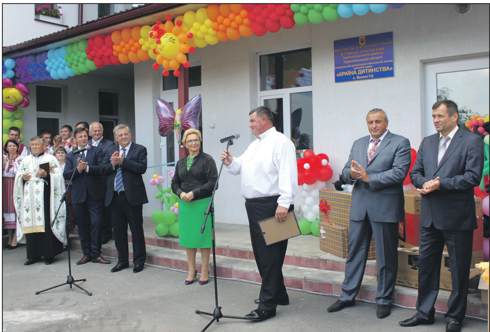
Під час відкриття дитячого садка "Країна дитинства" виступає Великогаївський сільський голова Олег Кохман. На урочистостях з цієї нагоди присутні куратор Тернопільської області, міністр охорони здоров'я України Раїса Богатирьова, голова Тернопільської облдержадміністрації Валентин Хоптян, перший заступник голови ОДА Микола Головач, заступник голови ОДА Петро Гоч, директор департаменту освіти і науки Тернопільської ОДА Іван Запорожан, голова Тернопільської районної державної адміністрації Віктор Щепановський.

Найбільше радості у той день було на обличчях діточок, їх батьків та вихователів. Адже відтепер саме вони стають справжніми господарями нового дошкільного закладу. Побут дитсадка повністю відповідає назві — втім, додає одне важливе слово — це Країна щасливого дитинства. Далеко не всі батьки можуть забезпечити дітям такі умови вдома. Меблі тут з екологічно чистого матеріалу, "здорові" іграшки, універсальний санвузол, стіни пофарбовані у спо-