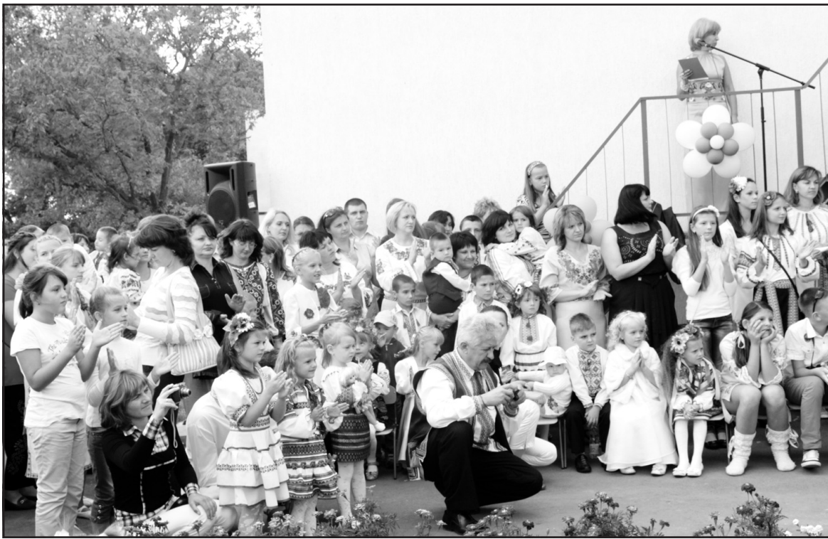
Перші вихованці дитячого садка “Країна дитинства”, їхні батьки та вихователі.

адміністрації Валентин Хоптян, відкриття дитячих садків завжди приємна подія, адже в цих закладах зростає наше майбутнє. Відтак, влада області налаштована сприяти позитивній тенденції відкриття дитячих садочків на Тернопіллі. Охопити дошкільною освітою 85% дітей — таке завдання ставить Президент України Віктор Янукович. Того дня голова Тернопільської ОДА Валентин Хоптян та міністр охорони здоров'я Раїса Богатирьова подарували колективу садочка “Країна дитинства” плазмовий телевизор. Натомість, наймолодші учасники свята віддячили гостям віршами і танцями.