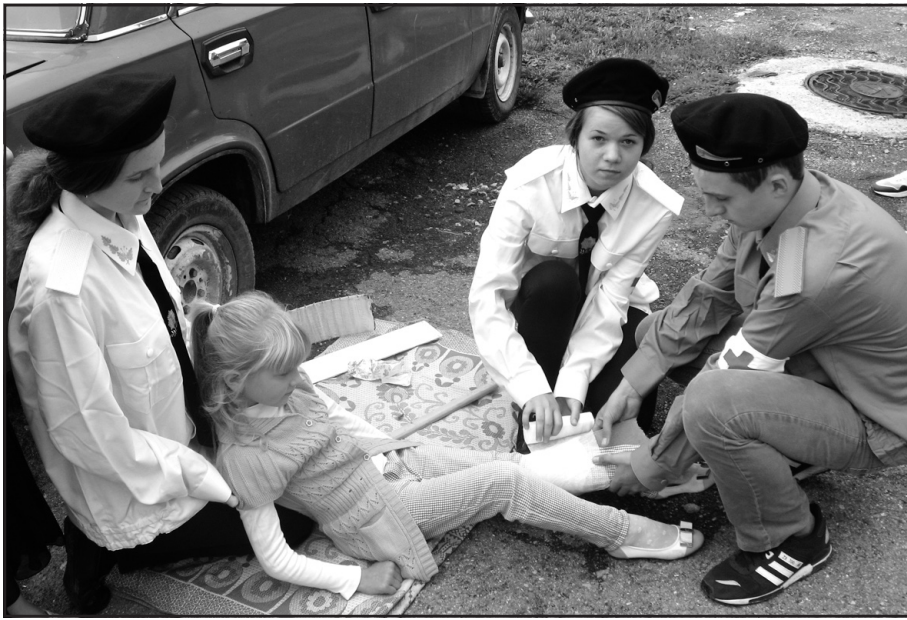
Великоглибочецькі школярі вчаться надавати першу медичну допомогу.

Згідно з оцінкою Глобального центру готовності до катастроф Міжнародної федерації Товариства Червоного Хреста, дорожньо-транспортні пригоди стали основною світовою причиною загибелі людей. Нині внаслідок ДТП кожні 30 секунд у світі помирає одна людина. Більшість цих втрат можна запобігти. Тренінги з надання першої допомоги навчають громадян діяти в перші хвилини після ДТП, оскільки більше 50% по-