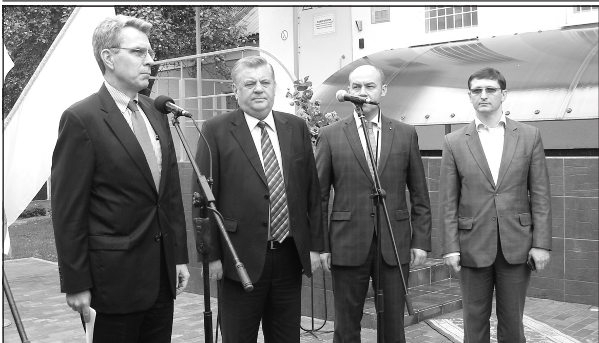
Під час відкриття лабораторії на базі Тернопільської обласної санепідемстанції (зліва направо) Надзвичайний та Уповноважений Посол США в Україні Джеффри Р. Пайетт, голова Тернопільської ОДА Валентин Хоптян, міський голова Тернополя Сергій Надал, в.о. голови Тернопільської обласної ради Сергій Тарашевський.