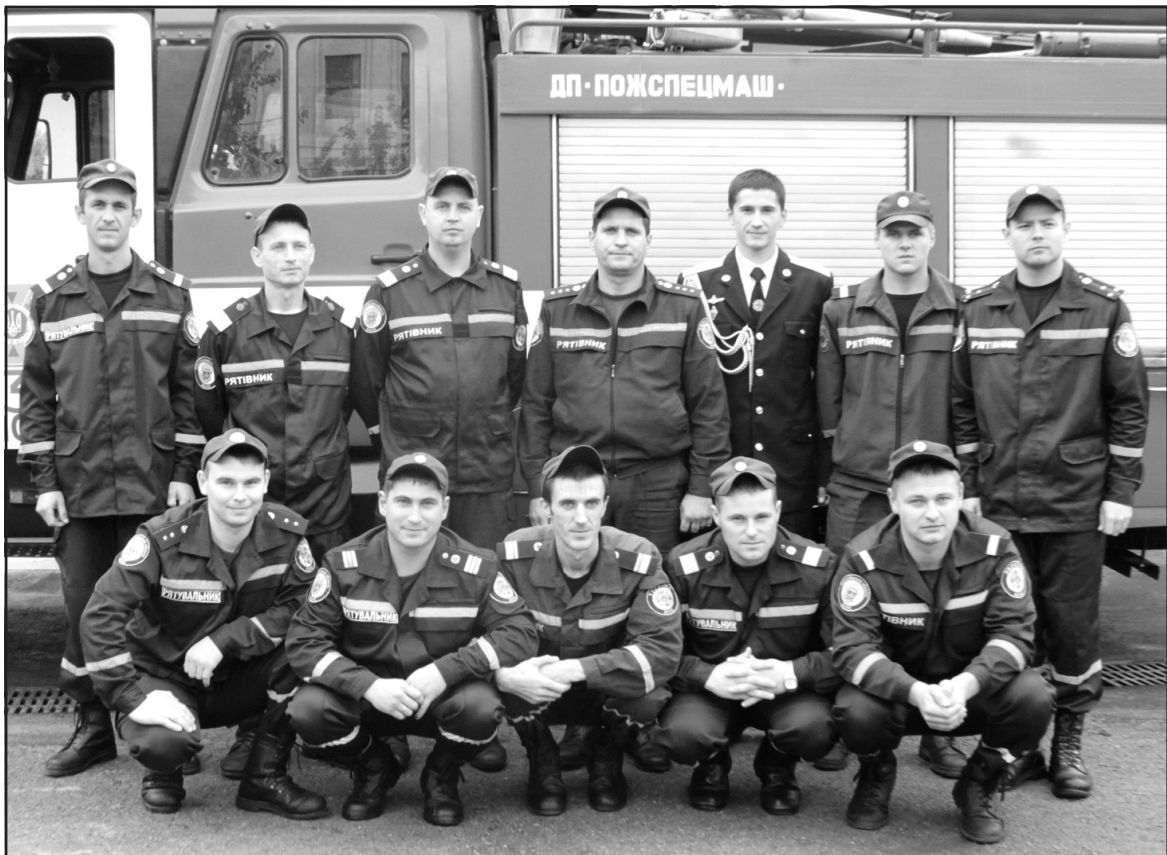
Працівники Тернопільського районного відділу управління МНС України в Тернопільській області у день професійного свята.

Урочистості з нагоди Дня рятувальника переконали усіх, що професія рятувальника — це вміння не тільки приходити на допомогу у хвилину біди, а й дарувати радість у святкові моменти, цінувати життя у всіх його проявах.