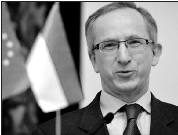
Голова представництва Євросоюзу в Україні Ян Томбінський.

Які можливості чекають на Україну у випадку, якщо угода про асоціацію України та Євросоюзу у Вільнюсі наприкінці листопада пройде успішно — йшлося під час презентації проекту "Сильніші разом" 10 вересня у Києві, що став початком інформаційної кампанії ЄС і України. У той день представлено новий логотип "Сильніші разом", створений у Києві, щоб презентувати нове партнерство України та Європейського союзу.