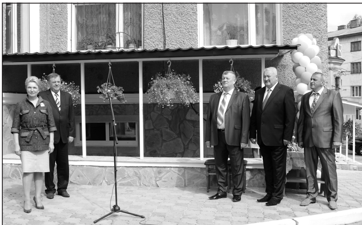
Під час відкриття оновленого відділення реабілітації та фізіотерапії ТРТМО. Зліва — віце-прем'єр-міністр, міністр охорони здоров'я України Раїса Богатирьова та голова Тернопільської ОДА Валентин Хоптян. Справа — голова Тернопільської районної ради Василь Дідух, головний лікар ТРТМО Ігор Вардинець, голова Тернопільської РДА Віктор Щепановський, 17 липня 2012 року.

— про програму збереження культурної спадщини Тернопільського району на 2012-2015 роки;