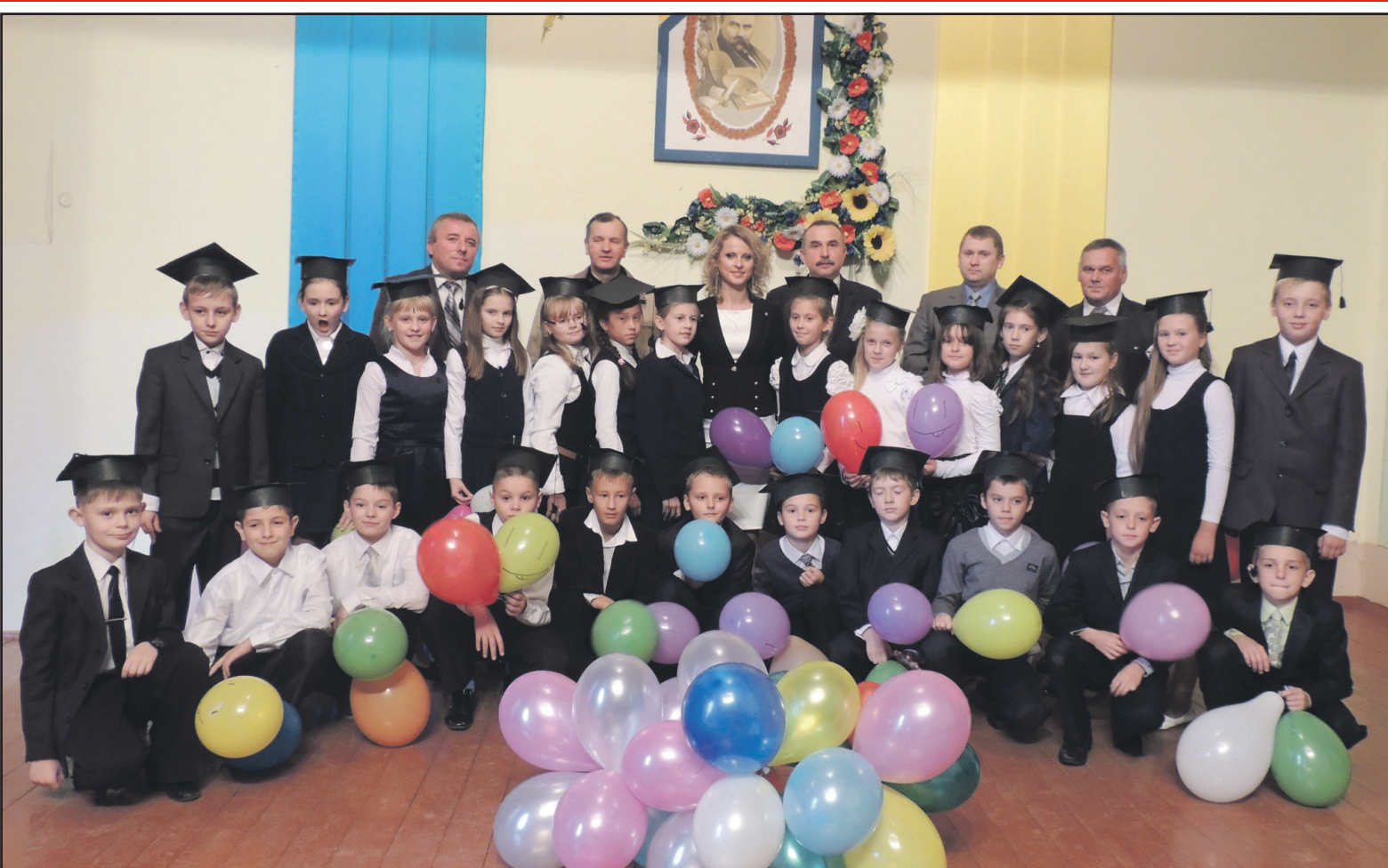
Юні гімназисти НВК "Великобірківська ЗОШ І-ІІІ ст.-гімназія ім. С. Балаєв" та гості свята.

1 жовтня 2013 року у НВК "Великобірківська ЗОШ І-ІІІ ст.-гімназія ім. С. Балаєв" відбулося традиційне свято — "Посвята в гімназисти". 26 учнів 5-А класу урочисто прийнято у перший гімназійний клас та в родину гімназистів.