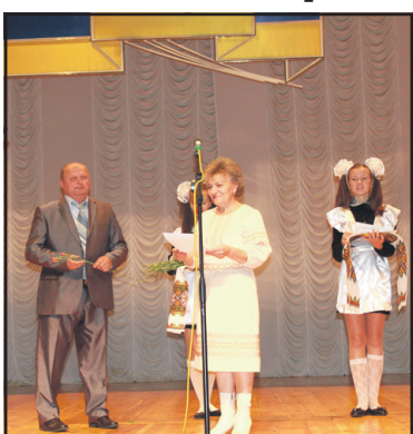
Святкова імпреза для освітян Тернопільського району з нагоди Дня вчителя.

www.trrada.te.ua - веб-сторінка Тернопільської районної ради