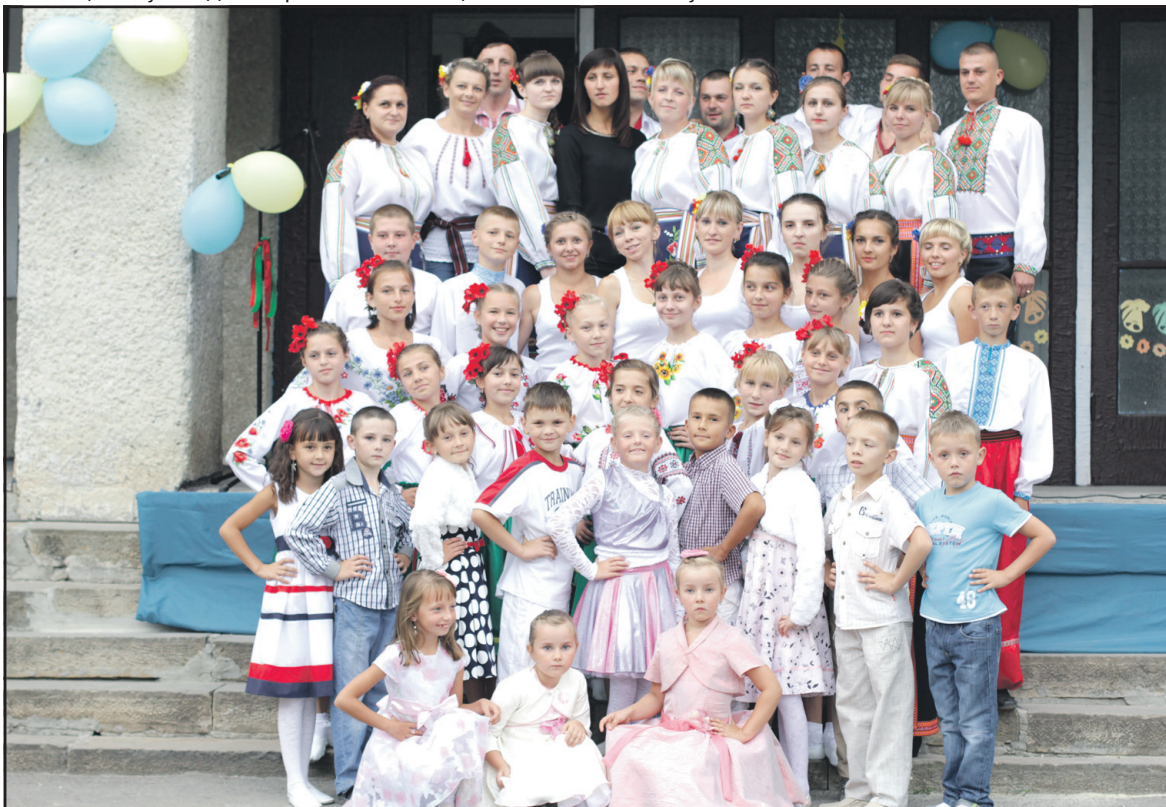
Учасники концерту з нагоди Дня Незалежності України у Мишковичах.