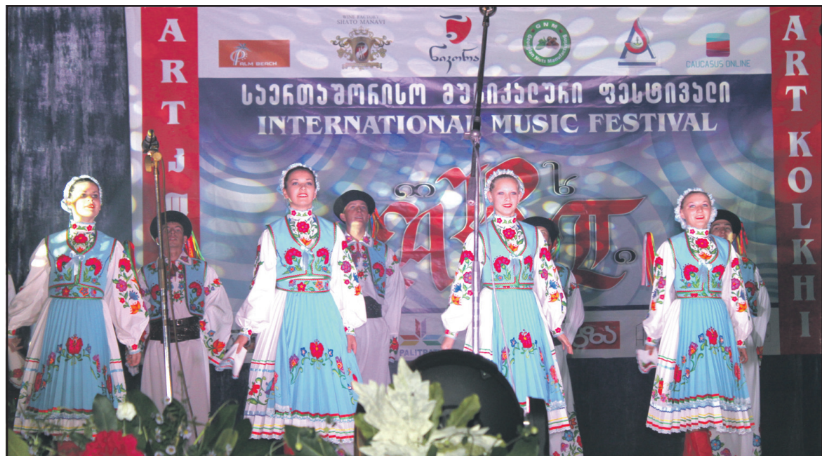
Народний аматорський ансамбль танцю “ГлоріяБай” БК с. Байківці під час гала-концерту Першого грузинського міжнародного музично-хореографічного фестивалю “Art Kolkhi”.