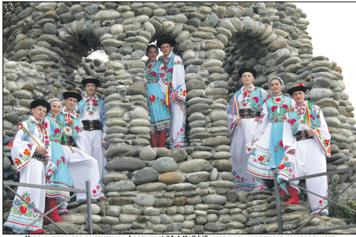
У день першого виступу на фестивалі “Art Kolkhi” учасники народного аматорського ансамблю танцю “ГлоріяБай” на території готелю “Палм біч” у м. Анаклія.

хотів спати, найбільші ж противники сну, відтак, не з'явилися на сніданок, бо засиділися за чаюванням та розмовами. Сніданком люди теж не виглядали аж надто енергійними, тому після першого прийому їжі до обіду всі тихо спали. Після другої трапези стало веселіше і жвавіше. Байківчани виходили на палубу, фо-