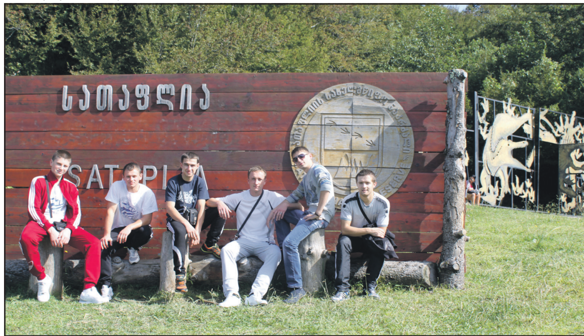
Чоловічий склад ансамблю “ГлоріяБай” на горі Сатапі, що знаходиться у південно-західній частині головного хребта Кавказу.