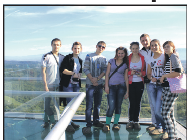
Мистецтво "ГлоріїБай" полонило Грузію.