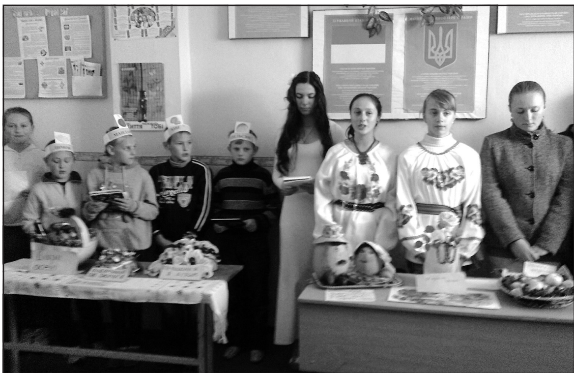
Під час Свята осені представляли свої композиції учні 5-9 класів Ігровицької ЗОШ І-ІІ ст.