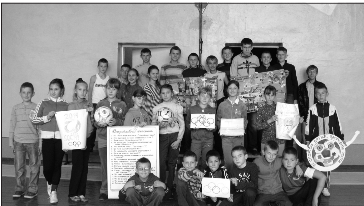
Учасники Олімпійського тижня "Історія – є. Майбутнє – твоє" – учні Великогаївської ЗОШ I-III ст.