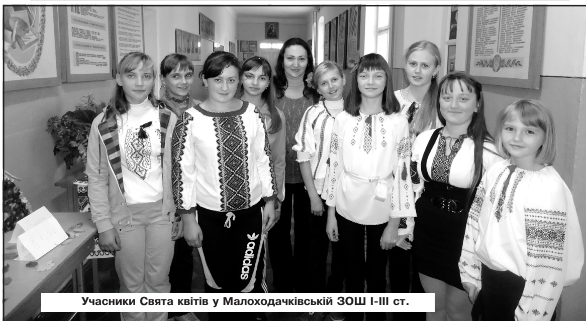
Учасники Свята квітів у Малоходачківській ЗОШ I-III ст.

За матеріалами Тернопільського РВ УДСНС України в Тернопільській області.