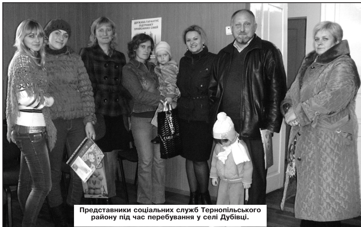
Представники соціальних служб Тернопільського району під час перебування у селі Дубівці.

Під час зустрічі з родинами, що опинились в складних життєвих обставинах, надано консультативно-довідкові соціальні послуги, інформаційно-консультативні послуги з питань надання пільг, субсидій, усіх видів державної соціальної допомоги та пенсійного забезпечення.