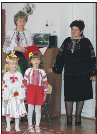
Дві п'ятірки плотичкої "Берізки".

www.trrada.te.ua - веб-сторінка Тернопільської районної ради