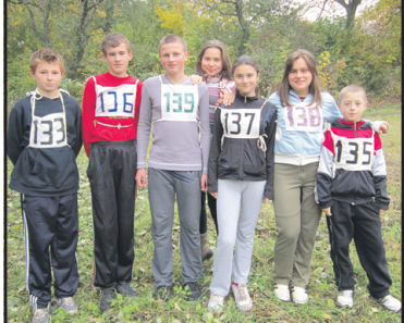
Юні петриківчани люблять легку атлетику.