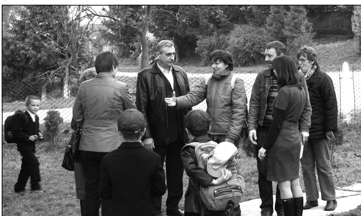
Гостей з-за кордону та представників Товариства Червоного Хреста України приязно зустріли у Буцнівській ЗОШ I-III ст.

Детальніші довідки за телефоном 15-07, 52-12-27 або у центрі обслуговування платників Тернопільської об'єднаної ДПІ ГУ Міндоходів у Тернопільській області.