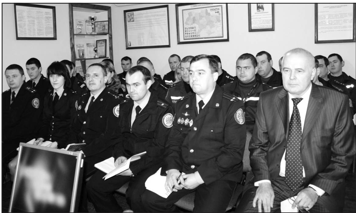
Особовий склад рятувальної служби Тернопільського району під час наради.