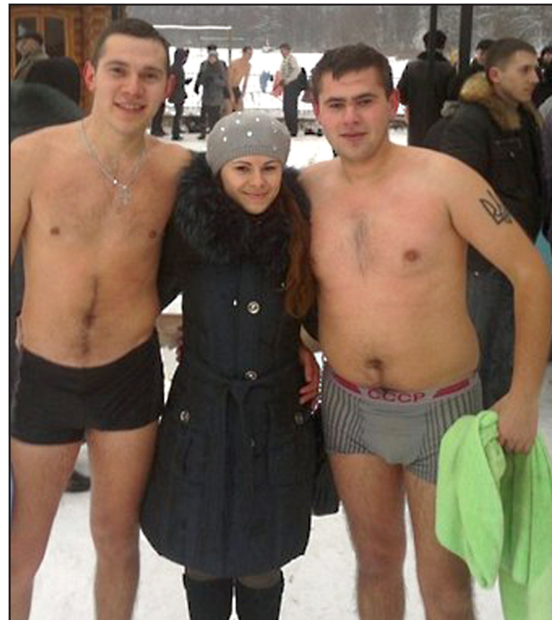
Здоровий дух — лише в здоровому тілі. Моржі з Тернопільського району у Зарваниці.