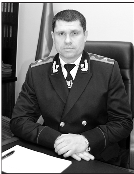
Прокурор Тернопільської області Геннадій Мовчан.

ники прокуратури, як і інші громадяни, несуть кримінальну відповідальність.