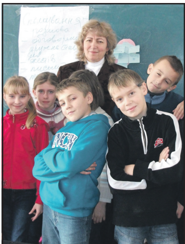
Труднощі адаптації в новому середовищі — поради психолога.