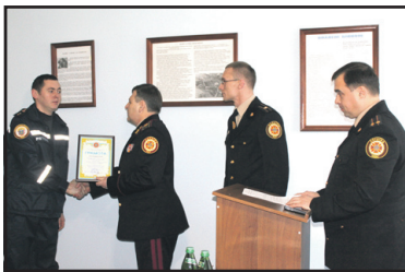
МНСники на варті нашої безпеки.

www.trrada.te.ua - веб-сторінка Тернопільської районної ради