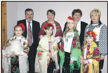
Чин Соборності: сторінки історії.