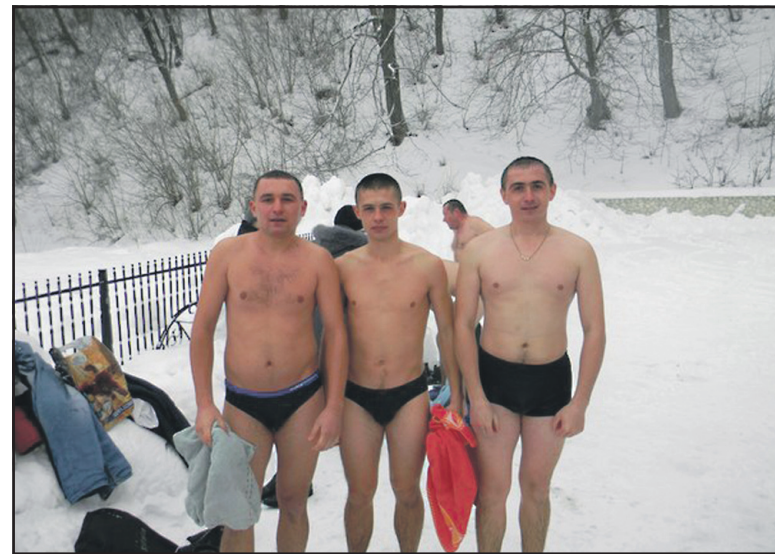
Не страшні йорданські морози для моржів з села Грабовець Тернопільського району.