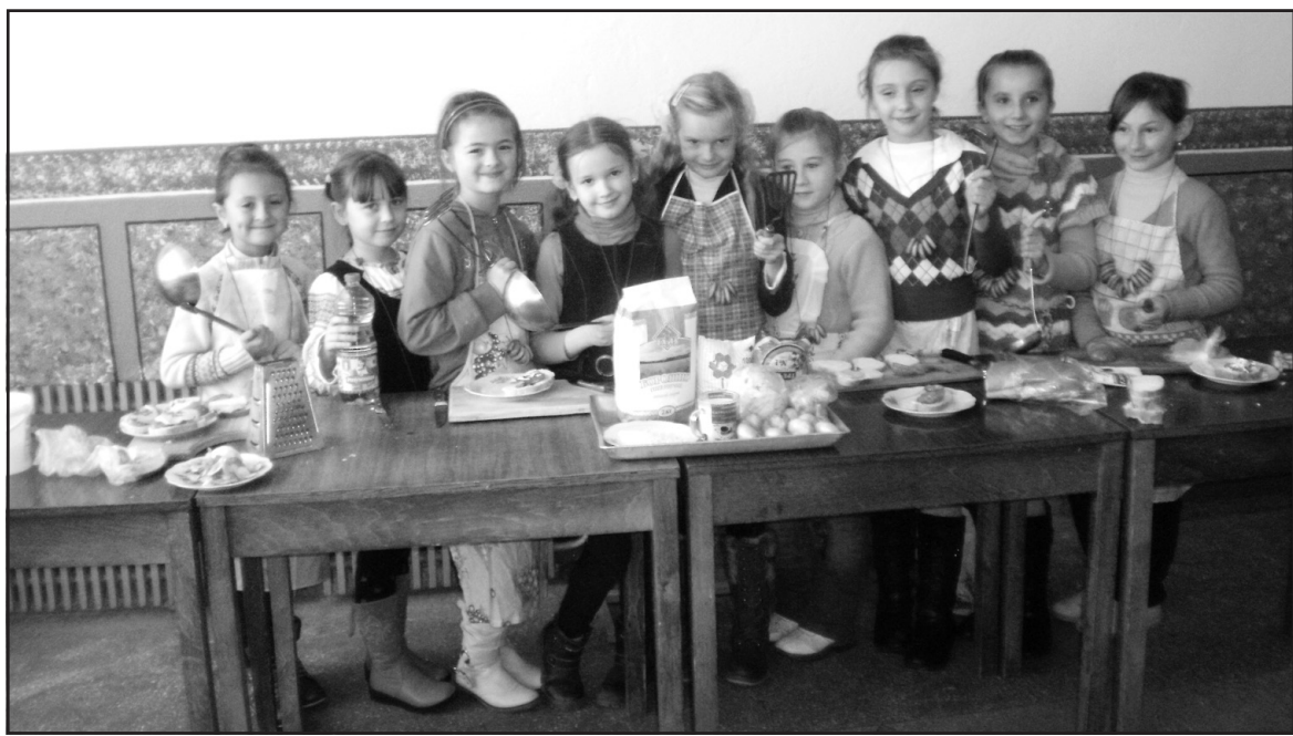
Господарочки Ангелівської ЗОШ І-ІІІ ст. — учениці 2-4 класів.