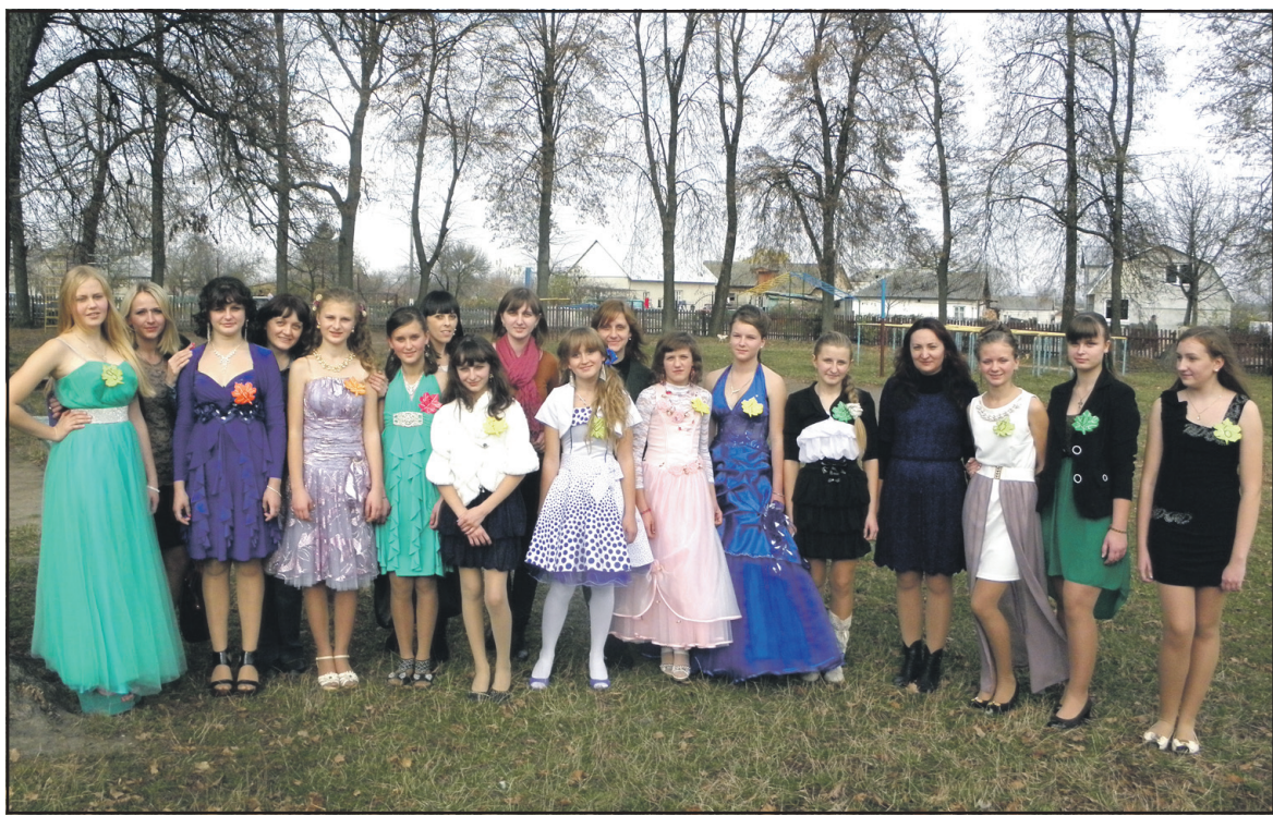
Юні красуні — старшокласниці Малоходачківської ЗОШ I-III ст.