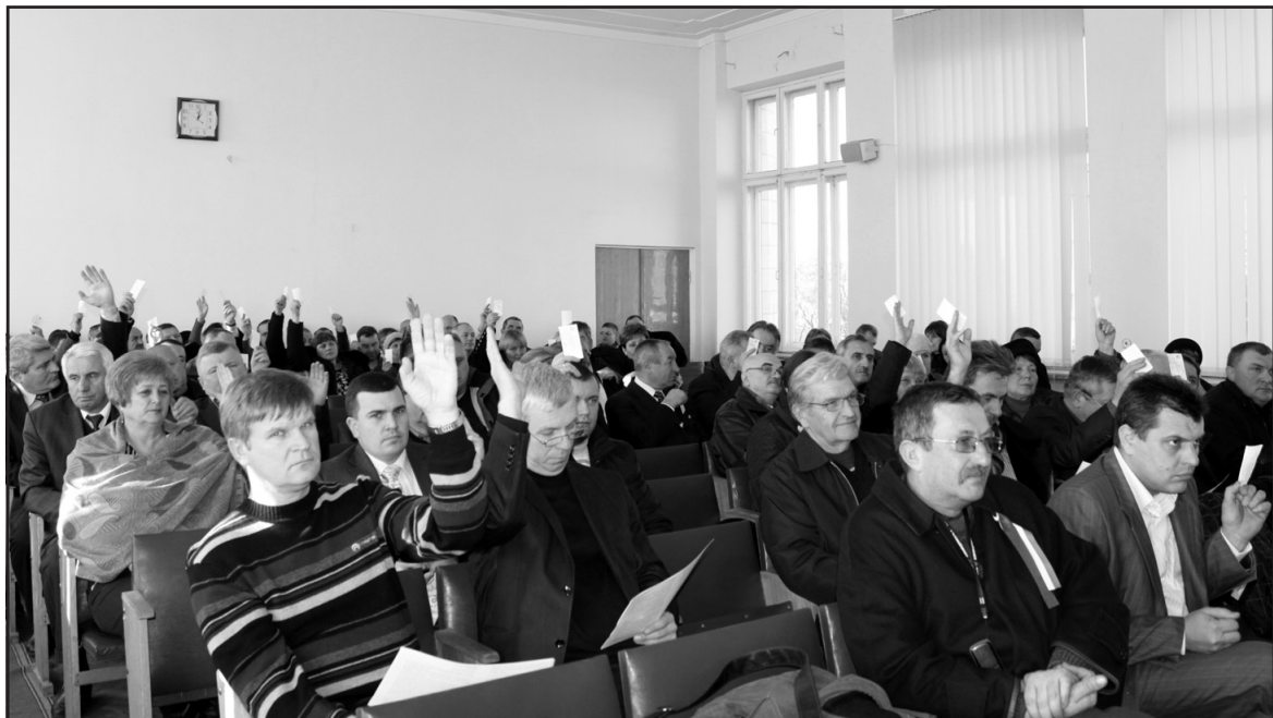
Депутати Тернопільської районної ради проголосували за імпичмент Президента, відставку уряду та дострокові вибори до Верховної Ради.