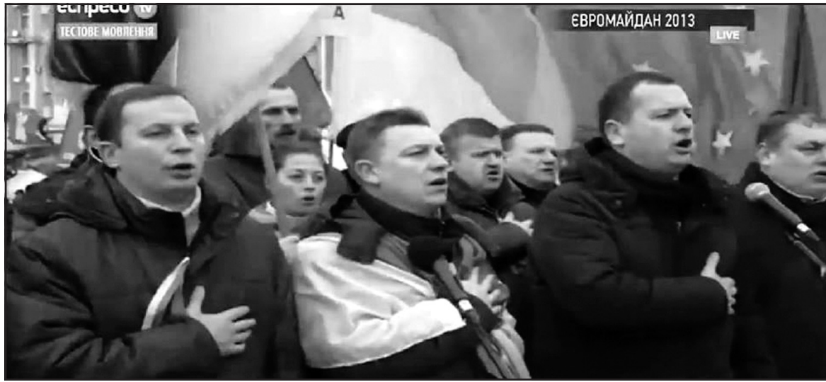
Депутати Тернопільської обласної ради на майдані в Києві перед виізною сесією облради.