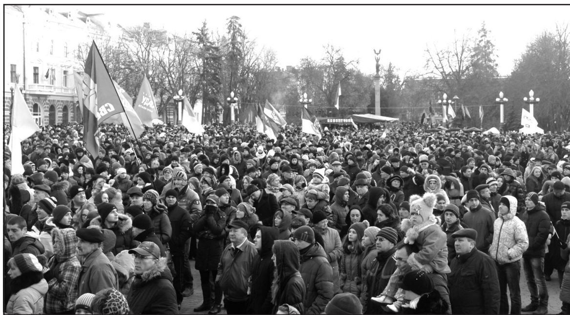
На Театральному майдані Тернополя 1 грудня 2013 року.

Лідер ВО "Батьківщина" Арсеній Яценюк ще перед початком сесії заявив, що у випадку провалу голосування за відставку уряду, опозиція вимагатиме від Президента України Віктора Януковича ухвалити відставку уряду. "Ми не будемо голосувати за відставку уряду... Україні потрібен спокій, стабільність і правопорядок. А ви цього забезпечити не можете", — відповів регіонал Володимир Олійник опозиційним депутатам. Прем'єр-міністр України Микола Азаров негативно відреагував на ситуацію, що склалася сьогодні в країні, закликав мітингувальників звільнити всі адмінбудівлі задля відновлення їх роботи. У своєму зверненні він сказав: "Особливо звертаю увагу тих окремих місцевих громад на західі країни — підкреслюю, одиничні приклади — коли місцева влада припинила роботу для участі у протестах. Така аморальність і безвідповідальність місцевих чиновників може призвести до того, що на центральному рівні кошти будуть виділені, проте на місцевому рівні вони, в зв'язку з непрацюючою місцевою владою, просто не дійдуть до отримувачів".