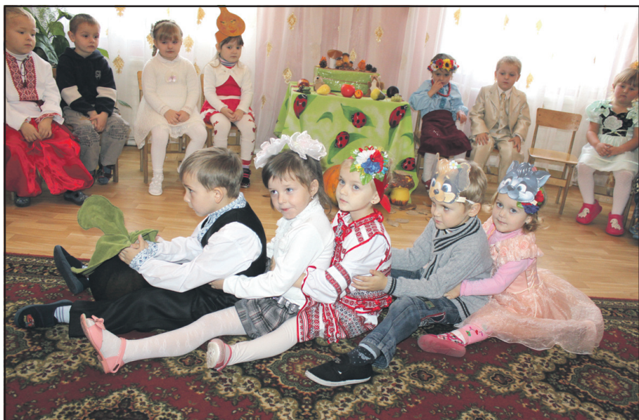
Діти стали героями української народної казки "Ріпка".