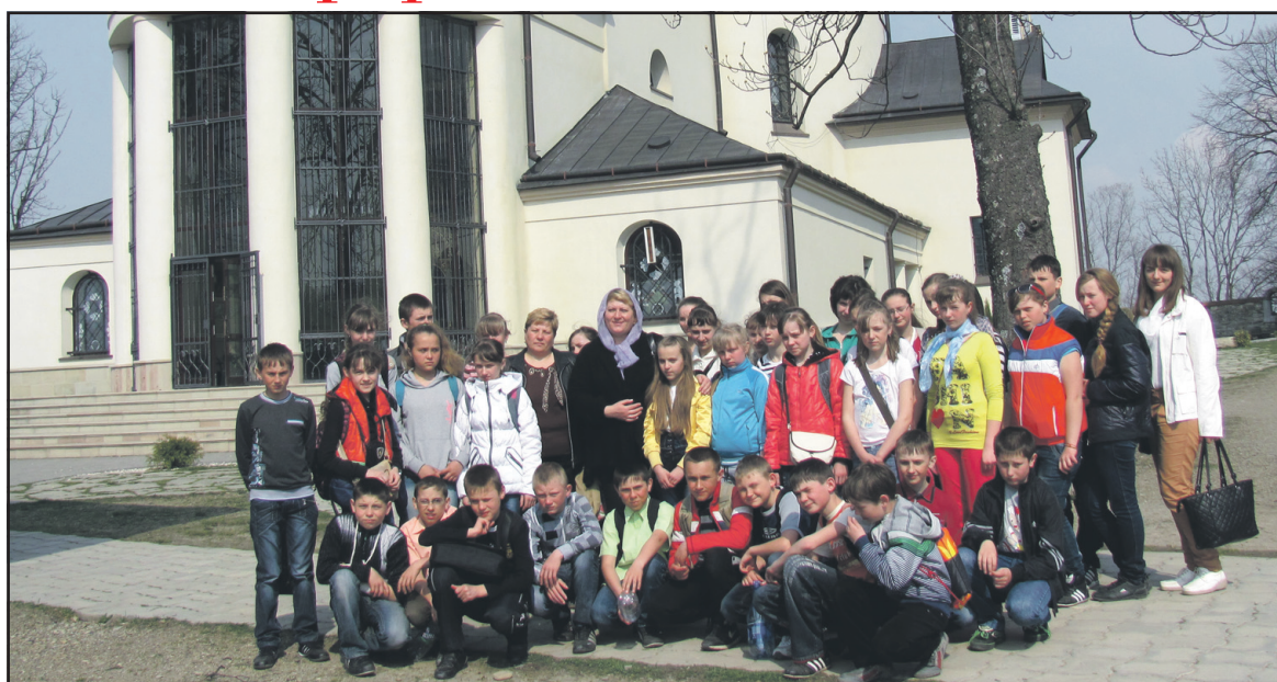
На території Гошівського монастиря.