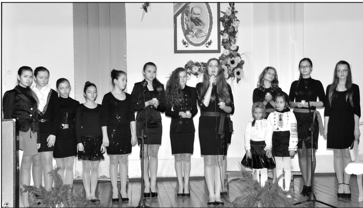
Учасники уроку-реквієму в НВК "Великобірківська ЗОШ І-ІІІ ст.-гімназія ім. С. Балаєв".