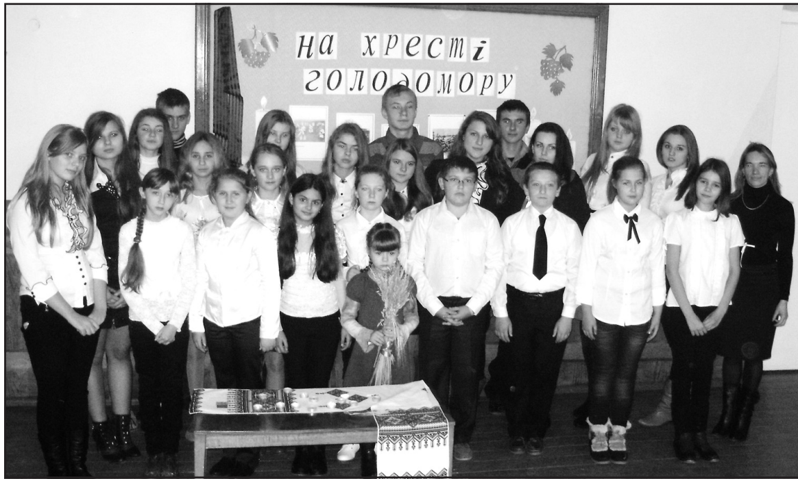
Учасники виховного заходу “На хресті Голодомору” в Ангелівській ЗОШ І-ІІІ ст.

Голодомор 1932-1933 рр. — «неопалима купина» українського народу — куш, який ніколи не припинить горіти, рана, що ніколи не загоїться. З кожними роковинами ця рана все більше ятриться — з'являються все нові і нові документальні підтвердження, спогади свідків тих жорстоких подій, виходять друком прозові та віршовані твори, які змальовують жахіття, що довелося пережити нашому народові на своїх рідних землях. Протягом багатьох десятиріч було заборонено навіть згадувати