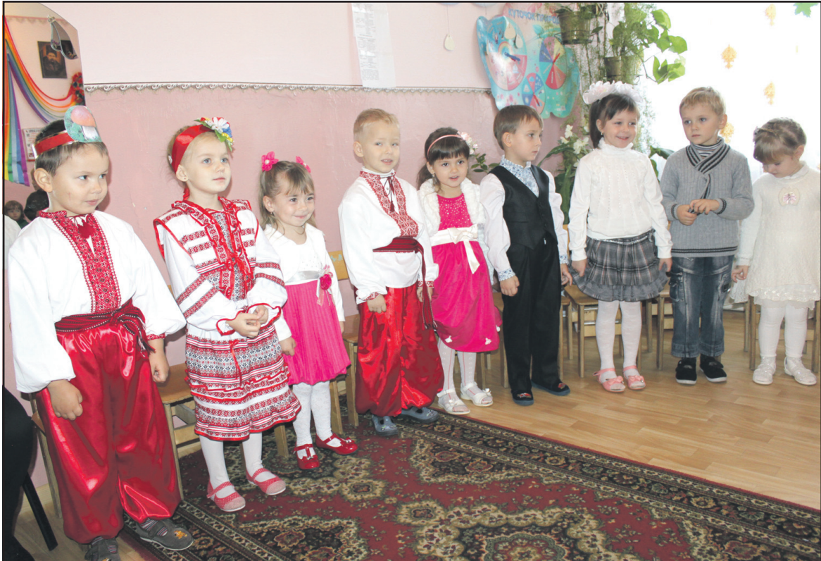
Учасники свята піснями і танцями привітали осінь.

На завершення гості свята щедро нагородили малят оплесками, а батьки почастували осінніми дарунками.