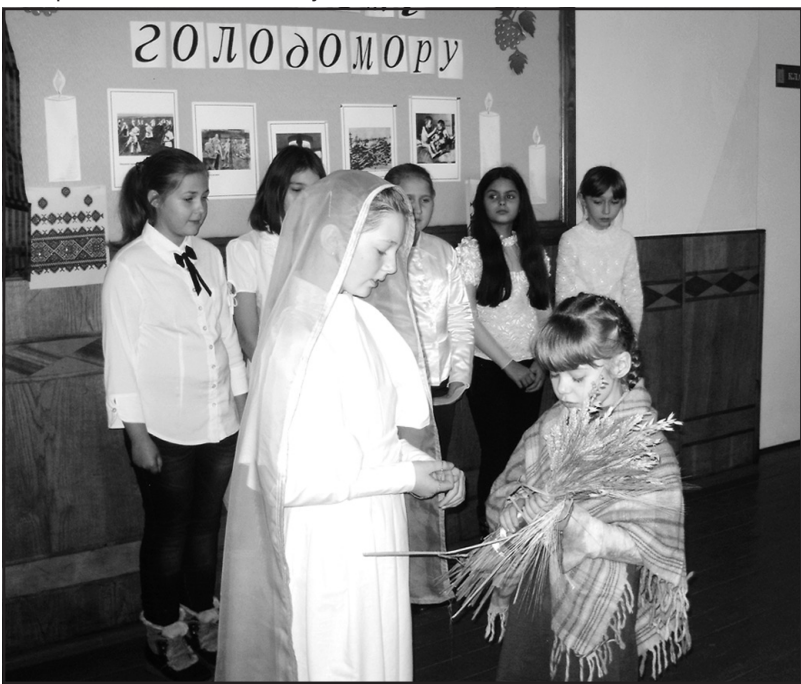
Сценка “Матір Божа і дівчинка”.

1932-33 рр. І лише в останнє десятиліття український народ нарешті отримав можливість сказати правду про те, як завзяті слуги сталінського Кремля розпинали Україну на голодоморних хрестах. І хай комусь здається, що не варто повертатися до тих далеких днів, бо наші теперішні проблеми вимагають від нас особливі зусилля. Не можна не відчувати людський біль, бо ми — нащадки тих, хто пережив страшний безодню людського горя і відчаю. Ми мусимо зберегти пам'ять про Голодомор та у 80-ті роковини глосно заявити всьому світові про незмірний злочин проти нашого народу.