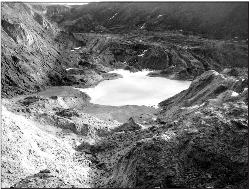
Тут, на місці колишнього піщаного кар'єру, могло б бути гарне місце для відпочинку...

Галина ЮРКА — ТРР “Джерело”. Фото автора.