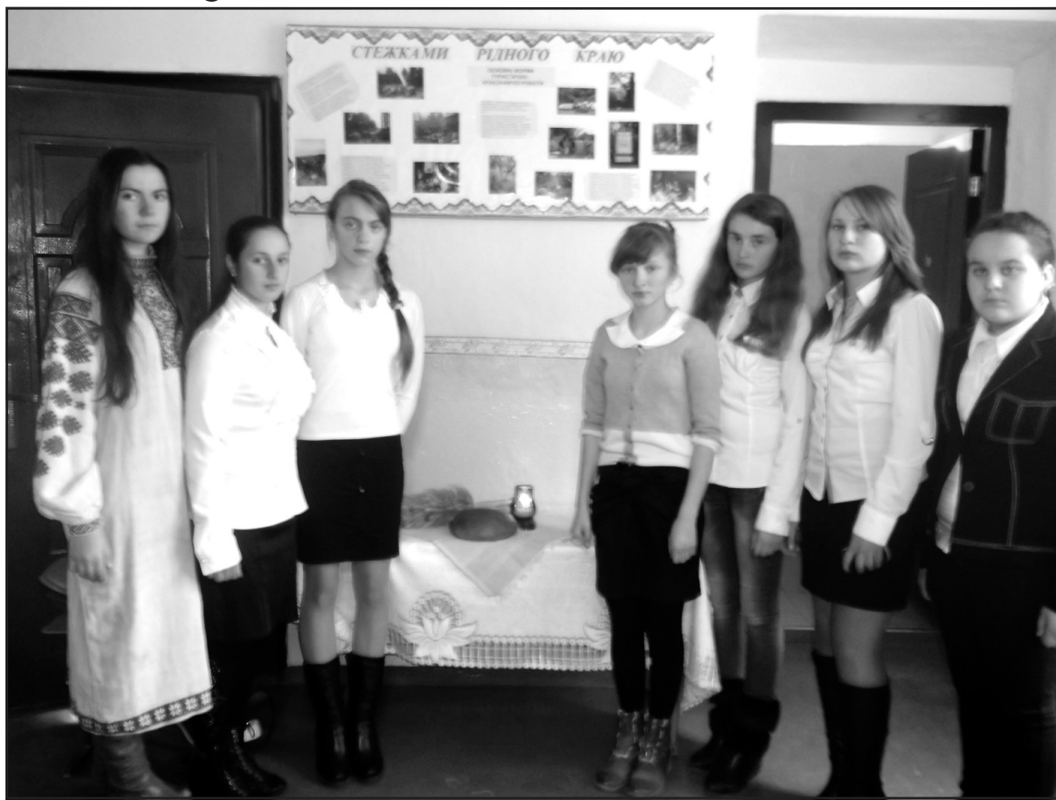
Старшокласниці Ігровицької ЗОШ I-II ст. під час лінійки пам'яті "Біль душі людської".

Ми зараз не усвідомлюємо, що таке справжній голод. Чимало людей недоїдають, несучи тягар бідності. Інші голодують, щоб схуднути. Та хіба це допоможе нам осягнути глибину могил тих мільйонів україн-