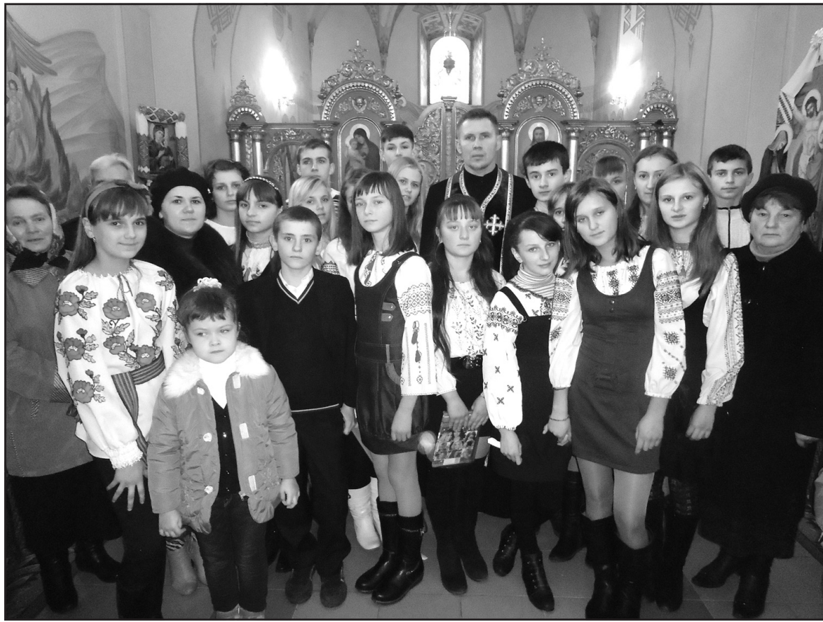
Учасники хресної дороги в церкві св. Архистратига Михаїла с. Малий Ходачків.

В одній християнській пісні йдеться: "Люблю цей світ за те, що в ньому є діти". Найщиріші молитви – це молитви з дитячих уст. Девізом хресної дороги стали слова: "Хто молиться співаючи, той молиться двічі". Кож-