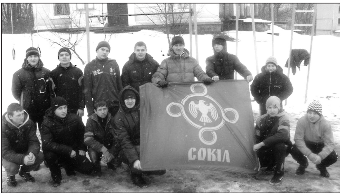
Учасники першого зимового Кубка Тернопільського району із Street Workout.