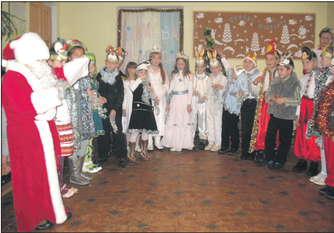
Учні Буцнівської ЗОШ I-III ст. під час новорічно-різдвяного дійства.