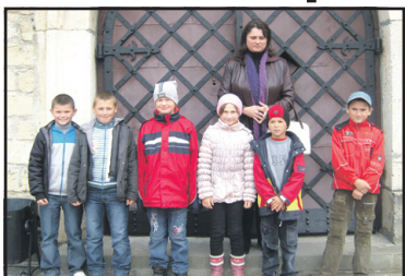
"Золоте кільце" — Збаразький замок вабить дорослих і дітей.