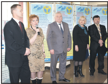
День відкритих дверей у Будинку праці в Тернополі "відкриває" молодим шлях у професію.

www.trrada.te.ua - веб-сторінка Тернопільської районної ради