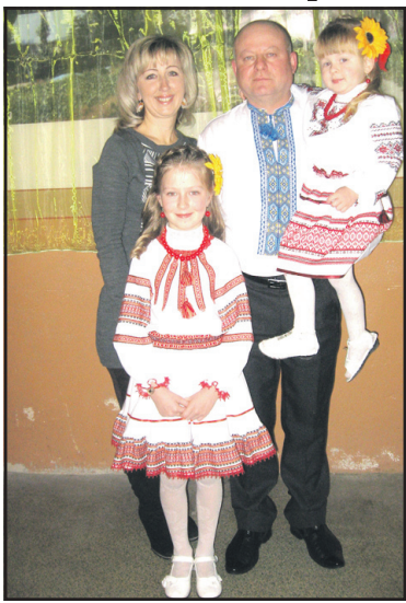
На родинному святі у Кип'ячці.