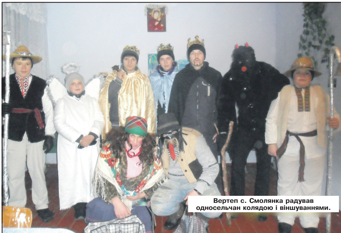
Вертеп с. Смолянка радував односельчан колядою і віншуваннями.