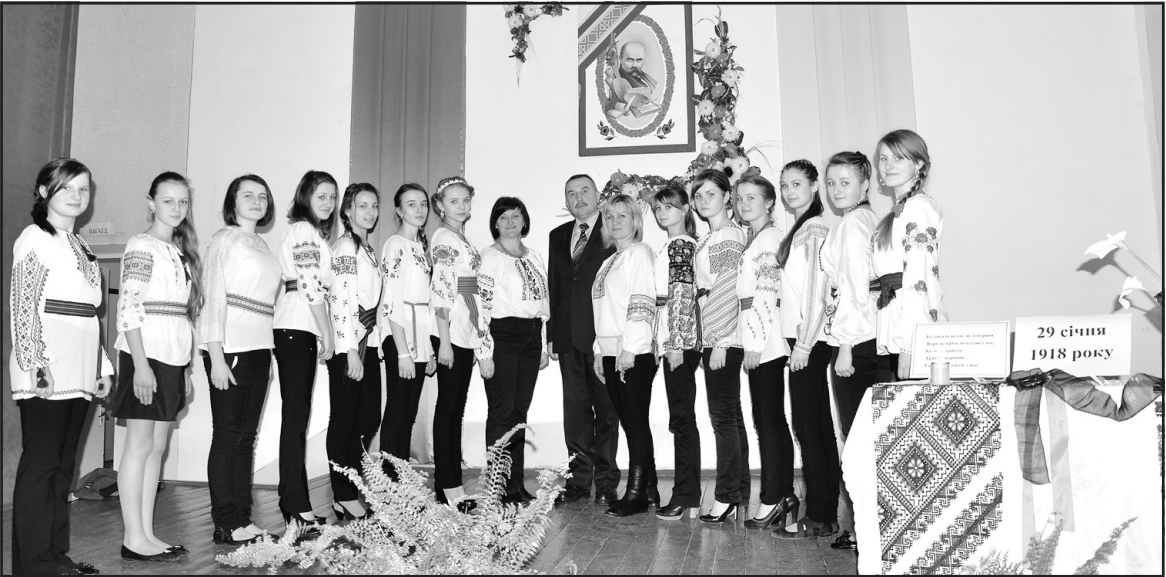
Учні Великобірківської школи-гімназії — учасники тематичної виховної години, присвяченої пам'яті Героїв Крут.

МЕГАДЖЕК — ПОТ — не виграно. МЕГАПРИЗ — не виграно. 5 номерів — 2 гравці — 15 000 грн. 4 номери — 198 гравців — 280 грн. 3 номери — 3 386 гравців — 26 грн. 5+ Мегакулька — 1 гравець — 30 000 грн. 4+ Мегакулька — 23 гравці — 560 грн. 3+ Мегакулька — 420 гравців — 52 грн.