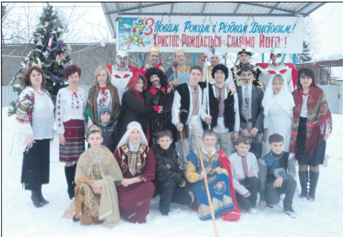
Учасники різдвяного дійства "Вертеп" клубу с. Ступки біля новорічної ялинки на центральному майдані села — Площі Незалежності.